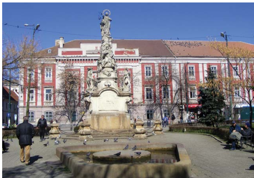
A Szabadság tér, a régi Városháza épületével

Délután zenével és nemzeti zászlókkal díszfelvonulást tartottak. Magyar nevet kapott a belváros néhány utcája és tere. A katonai díszteret, a Paradeplatz-ot Szabadság térnek nevezték el, Hunyadira ke-