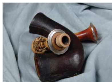
Az ereklyegyűjteményről a fotókat a B&B Helios készítette