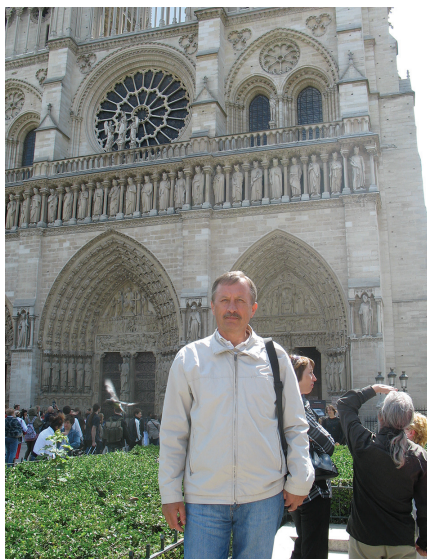
На фоні собору Нотр-Дам де Парі (Франція), 2012 р.