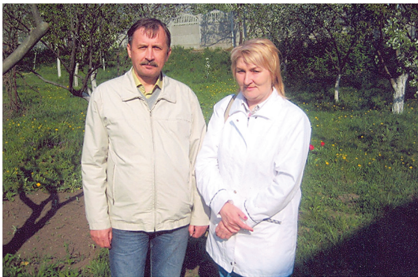
З дружиною Інною, 2010 р.