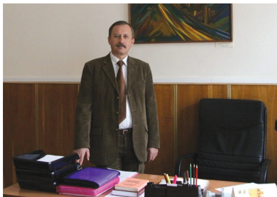
Декан факультету гуманітарних наук Національного університету «Києво-Могилянська академія», 2009 р.