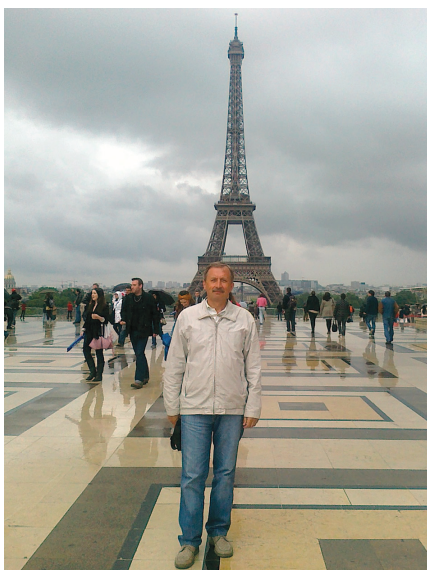
«Прощання з Парижем» (Франція), 2012 р.