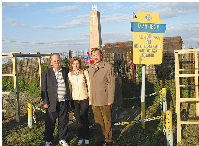
На місці Задунайської січі. Верхній Дунавець (Румунія), 2008 р.