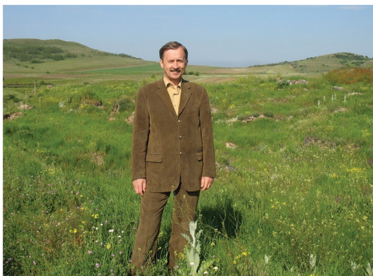
На руїнах фортеці Діногетії на Дунаї, де перебував київський князь Святослав (Румунія), 2008 р.