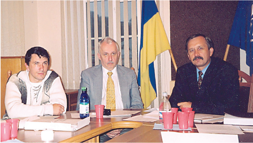
На чолі президії спеціалізованої вченої ради із захисту докторських (кандидатських) дисертацій з історії в Національному університеті «Кієво- Могилянська академія», 2005 р.