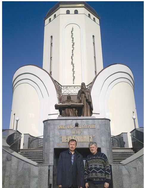
Перед музеєм Пересопницького Євангелія (с. Пересопниця), 2014 р.