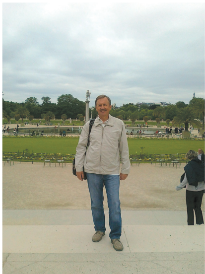
У Люксембурзькому саду Парижа (Франція), 2012 р.