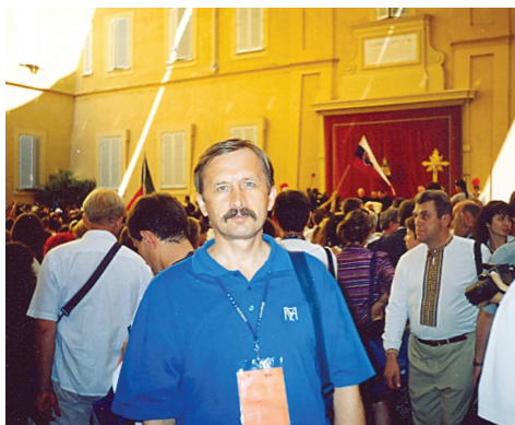
На прийомі в Папи Римського Іоанна Павла II (Італія), 2003 р.