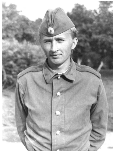
На студентських військових зборах під Батурином, 1975 р.