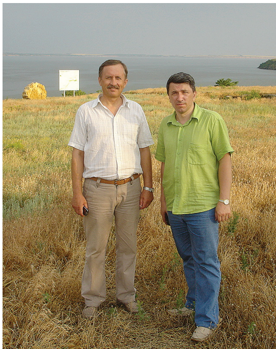
На місці Кам'янської Січі (с. Республіканець), 2011 р