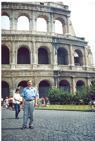
Поруч з римським Колізеєм (Італія), 2003 р.