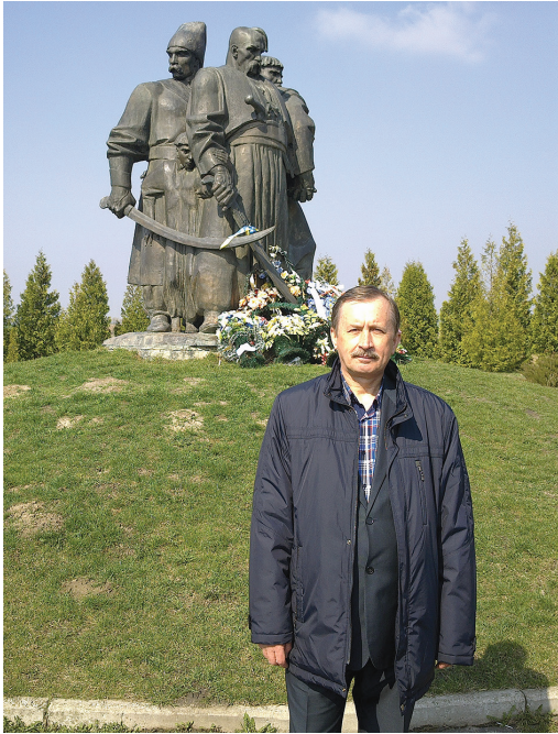
Поруч з монументом козацької звитяги, на місці Берестецької битви, 2014 р.