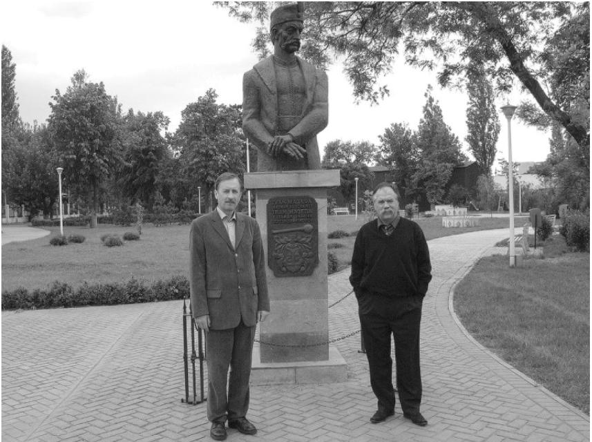
Біля пам'ятника гетьмана України Івана Мазепи в парку свободи м. Галац (Румунія), 2008 р.