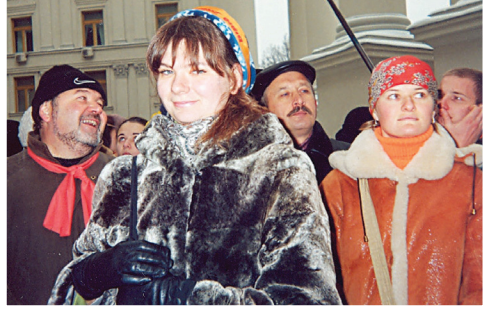
Під час «Помаранчевої революції», 2004 р.