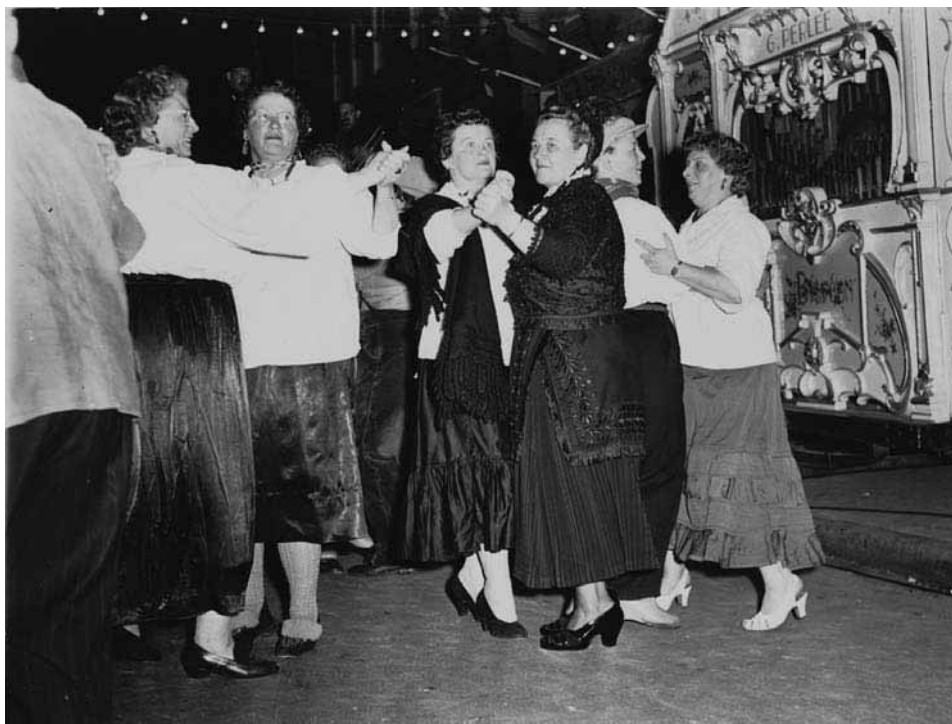
Afb. 49 Tijdens het Jordaanfestival wordt op de klanken van een orgel van G. Perlee gedanst.

ren er voor de Tweede Wereldoorlog nog tientallen orgels in de Amsterdamse straten te beluisteren (afb. 49), tegenwoordig is het er nog maar een handvol. En dan is er ook nog de heftige concurrentie van andere straatmuzikanten. Dit betekent echter niet dat het draaiorgel na de oorlog in de vergetelheid is geraakt, zoals sociologe Gerdy Bijleveld omstandig heeft aangetoond: