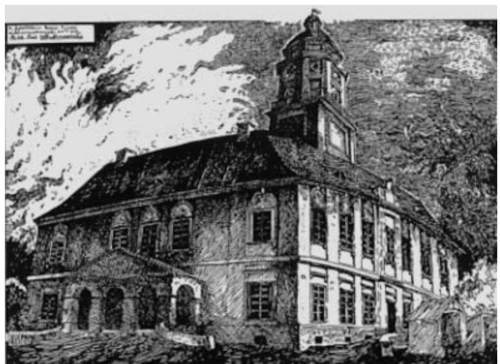
Рис. 5. Ратуша в Дрогобичі, XIX ст., рисунок автора