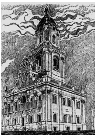
Рис. 4. Ратуша у Бучачі сер. XVIII ст., рисунок автора