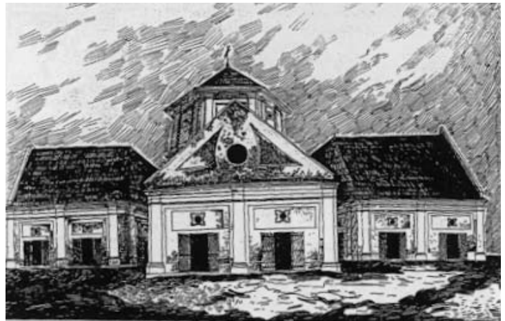
Рис. 3. Видяг ратуші у Гусятині, пер. пол. XVII ст., рисунок автора