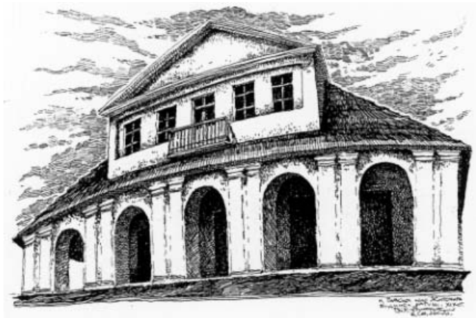
Рис. 6. Ратуша у Паволочі, XVIII – XIX ст., рисунок автора

У короткому огляді ратуш винесено за межі опису принципи і закономірності архітектурно-планувальних типів, а також стилістичні характеристики архітектурного вирішення фасадів. Окреме дослідження в майбутньому планується провести у ратуші Львова, яка є вираженням ідеології метрополій. Поза увагою залишилися дерев’яні ратуші, а також ратуші міст центральної України, у яких проявилися риси синтезу ідеології двох пограничних імперій – Австро-Угорської та Російської (рис. 6) [12].