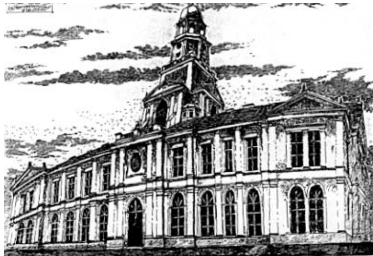
Рис. 1. Ратуша у Івано-Франківську, XIX ст., рисунок автора