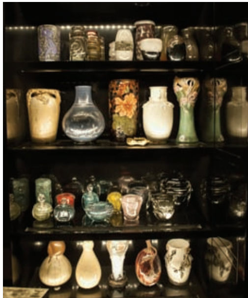
Vue du cabinet de collectionneur de Félix Marcilhac

Mardi 11 février - Lundi 17 février 2014