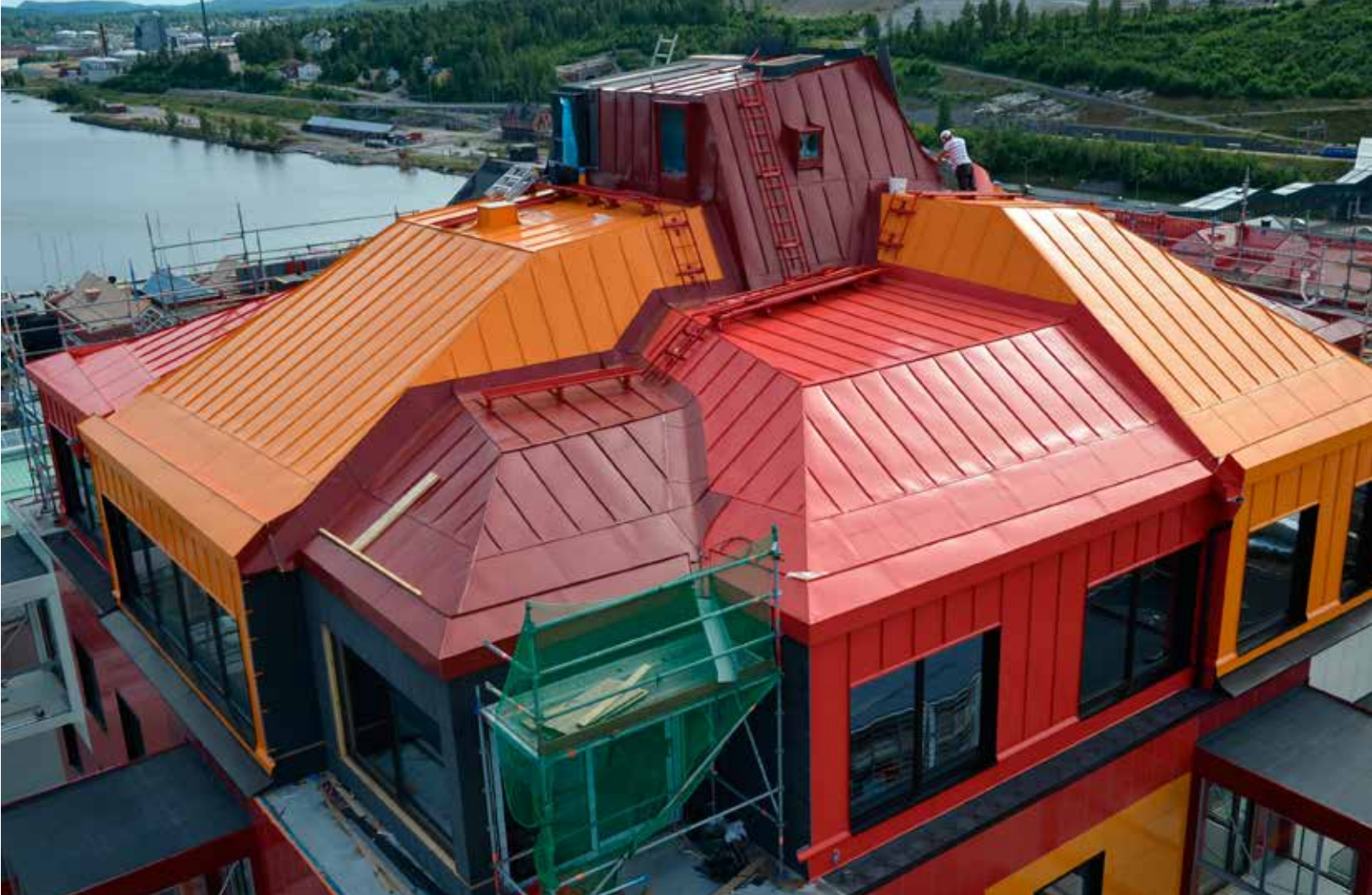
Taket på 500 kvadratmeter består av inte mindre än 30 mindre taktytor i tre olika kulörer.

– Men vi håller faktiskt på med ett projekt i Gällivare där de ville ha ett gnistrande vit fasad, så vi har använt oss av samma leverantör och en kulör som heter Glistering snow.