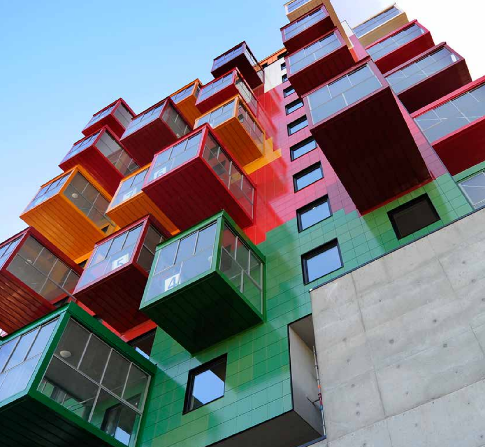
De 78 balkongerna förskjuts lite i sidled efter varje våning och har en plåtinklädd undersida i rätt kulör för att inte störa helhetsintrycket.