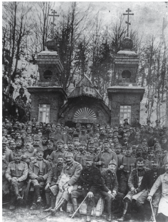
Ruska kapelica pod Vrščicem, kjer so pokopani tragično preminuli ruski ujetniki.

ujetniki in avstrijski stražarji. Težko je bilo zbrati reševalno ekipo, ker so se vsi bali ponovnega plazu. Franc Uran navaja, da so na kranjskogorski strani pogrešali 110 ruskih ujetnikov in šest ali sedem stražarjev in da je bilo žrtev še več, ker so bile v času nesreče na prelazu tudi ekipe s trentarske strani. 5