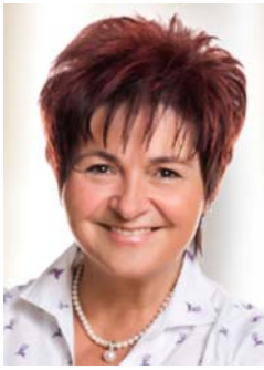
Bürgermeisterin Gerlinde Schneider

Sprechstunden montags, und mittwochs jeweils von 8 bis 9 und freitags von 16 bis 17 Uhr.