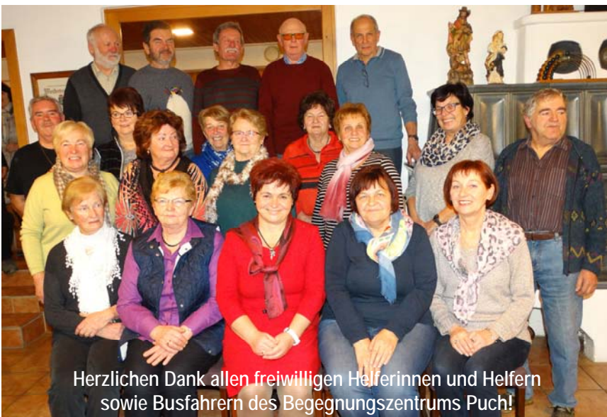
Herzlichen Dank allen freiwilligen Helferinnen und Helfern sowie Busfahrern des Begegnungszentrums Puch!

Nähere Infos unter www.wohnbau-steiermark.at oder unter www.umweltfoerderung.at