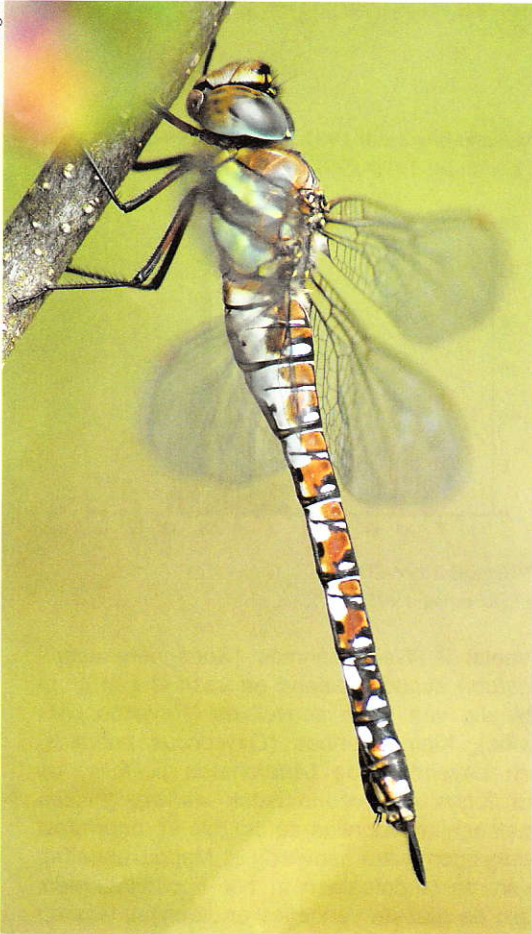
Paardenbijter, Aeshna mixta .