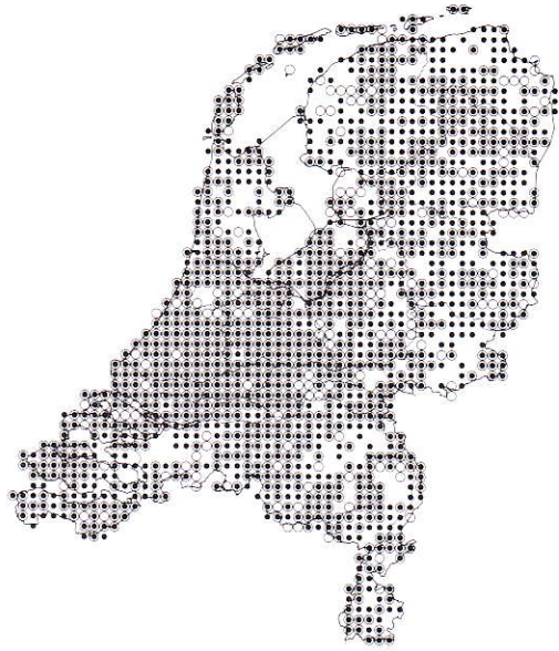
Verspreiding 1990-1997 (cirkel), 1998-2007 (stip). Distribution 1990-1997 (circle), 1998-2007 (dot).