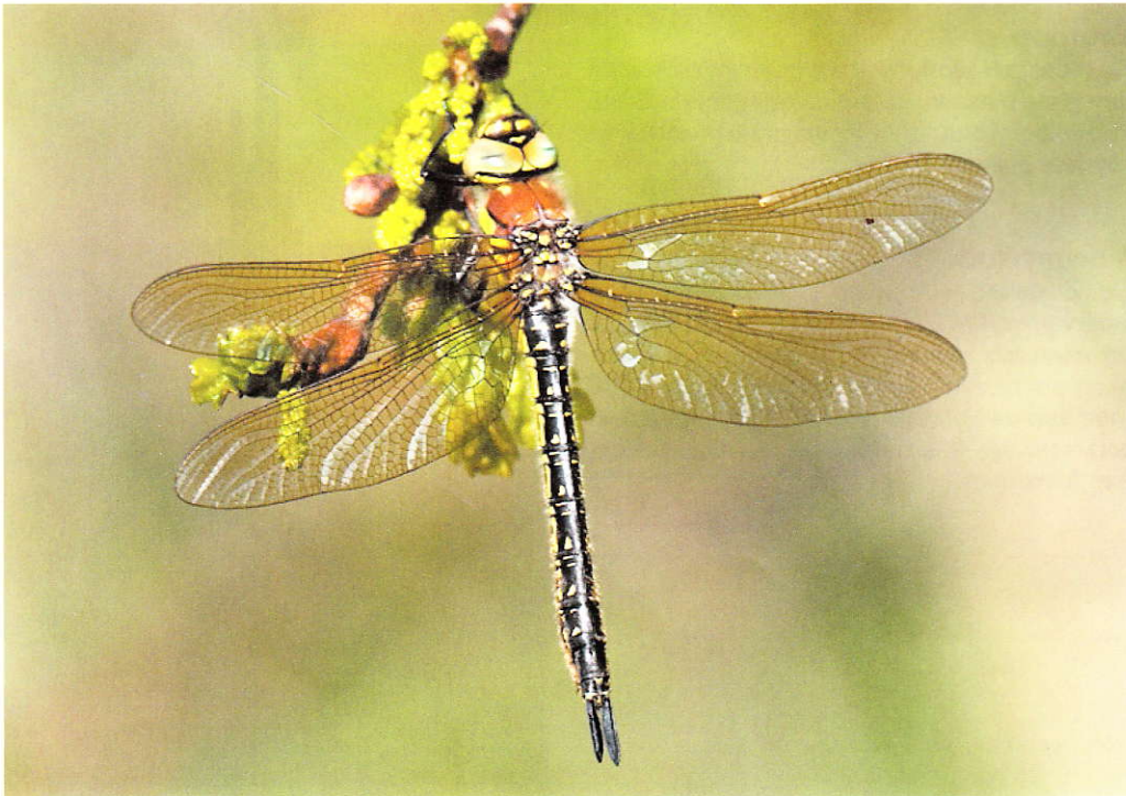
Glassnijder Brachytron pratense .