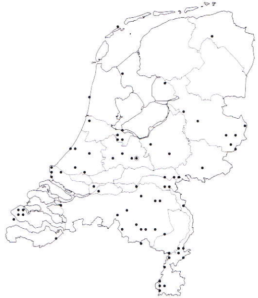
Verspreiding 1990-1997 (cirkel), 1998-2007 (stip). Distribution 1990-1997 (circle), 1998-2007 (dot).

De Zuidelijke keizerlibel is een zomersoort waarvan vrijwel alle waarnemingen uit juni, juli en augustus stammen. De vroegste waarneming stamt van 19 mei 1996. Met het toenemen van de voortplanting in Nederland zullen waarschijnlijk ook het aantal mei-waarnemingen toenemen.