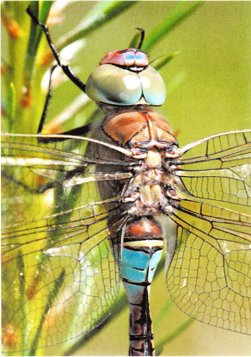
Zuidelijke keizerlibel, Anax parthenope .