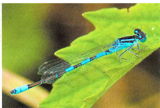
Gaffelwaterjuffer Coenagrion scitulum .