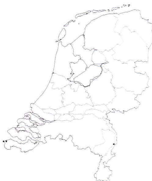
Verspreiding 1990-1997 (cirkel), 1998-2007 (stip). Distribution 1990-1997 (circle), 1998-2007 (dot).

De Gaffelwaterjuffer vliegt bij Cadzand bij ondiepe plasjes en poelen op de overgang van duinen naar het binnenland. Het is zeer waarschijnlijk dat de Gaffelwaterjuffer op meer plekken langs de kust en in Zuid-Nederland te vinden is. Kijk dan vooral op natuurontwikkelingslocaties, langzaam doorstroomde