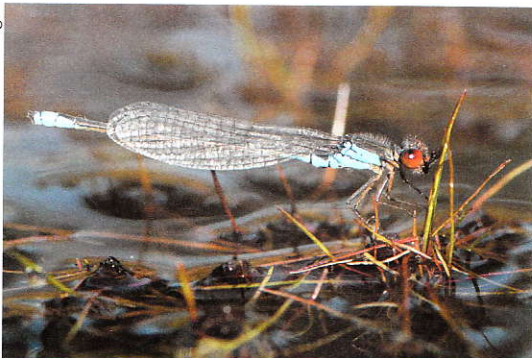
Kleine roodoogjuffer, Erythromma viridulum .