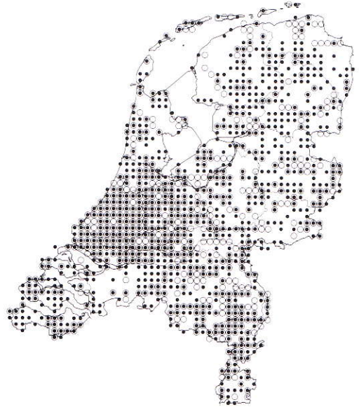
Verspreiding 1990-1997 (cirkel), 1998-2007 (stip). Distribution 1990-1997 (circle), 1998-2007 (dot).

Wordt de Kleine roodoogjuffer ooit de soort met de grootste verbreding van ons land? Het is een vraag die in de jaren '80 gemakkelijk met een volmondig "nee" beantwoord zou zijn. Een blik op de enorme vooruitgang van de laatste jaren laat zien dat het inmiddels geen ondenkbaar scenario is. Ondanks dat de soort ook in de periode voor 1998 al een algemene verschijning was geworden, heeft de soort zich de afgelopen tien jaar verder weten uit te breiden. Zo heeft ze inmiddels een bredere verspreiding dan de Grote roodoogjuffer ( E. najas ). In de periode voor 1998 waren er nog relatief weinig waarnemingen uit het noorden van het land. Hier heeft de afgelopen jaren de grootste uitbreiding plaatsgevonden. De Kleine roodoogjuffer komt inmiddels op alle Waddeneilanden voor.