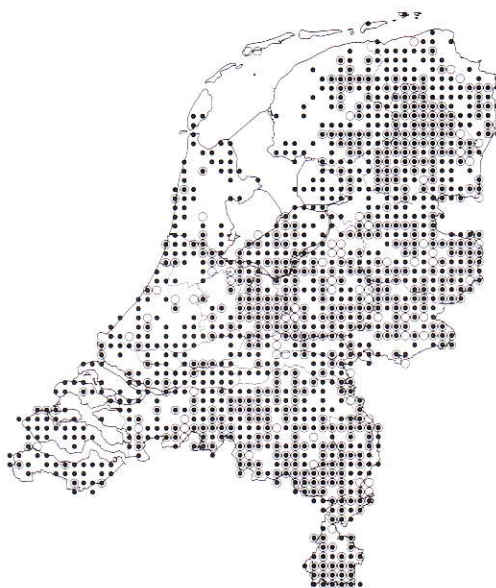
Verspreiding 1990-1997 (cirkel), 1998-2007 (stip). Distribution 1990-1997 (circle), 1998-2007 (dot).

De Platbuik is nog steeds een zeer algemene verschijning op de hoge zand- en lössgronden. In de periode 1990-1997 was de soort nog schaars in West-Nederland, maar hierin lijkt nu verandering te komen. Met name in de duinen, maar ook in kleigebieden en veenweidegebieden heeft een duidelijke uitbreiding plaatsgevonden. Oorzaken hiervoor zijn speculatief. Is het aantal voortplantingsgebieden voor deze pioniersoort toegenomen, bijvoorbeeld door een toename van natuurontwikkelingsprojecten, tuinvijvers en een meer dynamisch natuurbeheer in de duinen? Zet de vooruitgang van de Platbuik in het westen verder door en wordt de soort op termijn in heel Nederland algemeen?