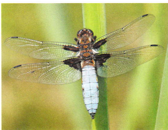
Man Platbuik Libellula depressa .