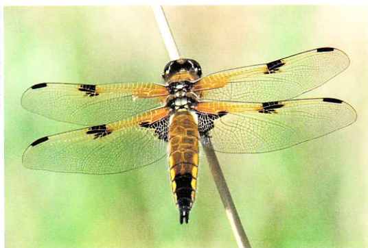
Viervlek Libellula quadrimaculata .