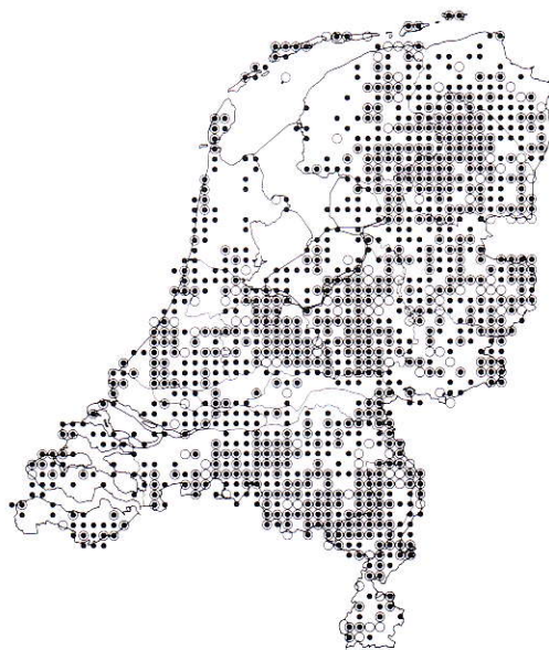
Verspreiding 1990-1997 (cirkel), 1998-2007 (stip). Distribution 1990-1997 (circle), 1998-2007 (dot).

De Viervlek is nog steeds een zeer algemene soort, vooral bij vennen op de zandgronden. Het lijkt erop dat de soort vooruit is gegaan in Groningen, de duinen van Noord-Holland en het rivierengebied. Bij vennen zijn hoge dichtheden van de Viervlek een aanwijzing voor verzuring. Is het denkbaar dat de gemiddelde populatiegrootte bij vennen gaat afnemen, nu verzuring een minder groot probleem is geworden? Vooralsnog lijkt het daar niet op: in het Landelijk Meetnet Libellen vertoont de soort een stabiele trend, in tegenstelling tot de andere soorten van het 'zure viertal' (Gewone pantserjuffer ( Lestes sponsa ), Watersnuffel ( Enallagma cyathigerum ) en Zwarte heidelibel ( Sympetrum danae )), die in het meetnet een matige afname laten zien.