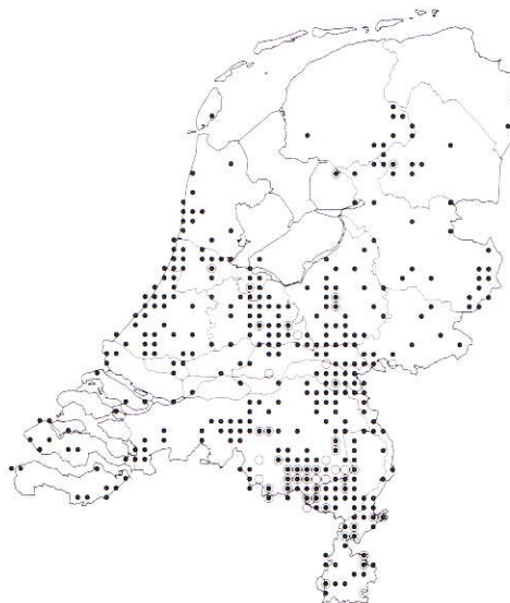
Verspreiding 1990-1997 (cirkel), 1998-2007 (stip). Distribution 1990-1997 (circle), 1998-2007 (dot).

De Bruine winterjuffer komt vooral voor bij matig tot voedselrijke wateren op de zandgronden zoals vennen, leemkuilen maar ook duinplassen. De soort preferereert ondiepe oeverzones met goed ontwikkelde vegetatie zoals Snavelzegge ( Carex rostrata ) of Riet ( Phragmites australis ). Daarnaast kan de soort worden aangetroffen bij petgaten en sloten (met o.a. Riet en lisdodden ( Typha sp.)) op laagveenachtige grond (LIBELLENWERKGROEP DRENTHÉ, 2007). In 2005 zijn enkele keren tandems waargenomen in uiterwaarden (in de omgeving van Wageningen), maar het is vooralsnog onduidelijk of de soort zich hier heeft gevestigd.