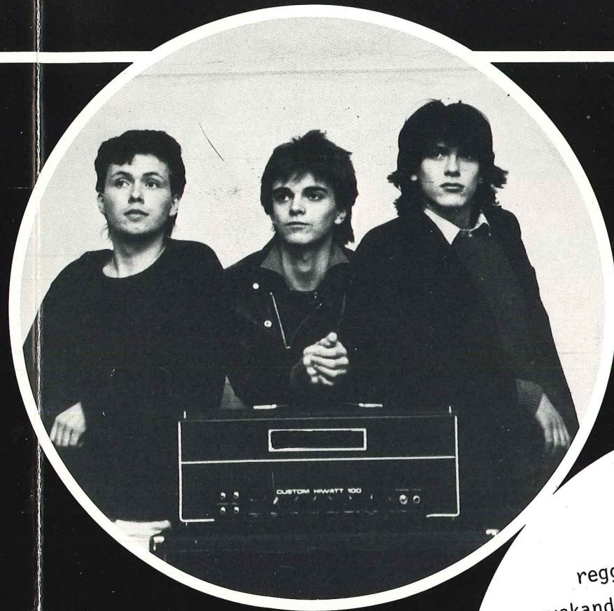
KNUGENS HAF blandar rock, pop, punk, reggae, resultatet blir en medryckande musik. Texterna speglar den verklighet vi lever i, med dess positiva och negativa sidor.