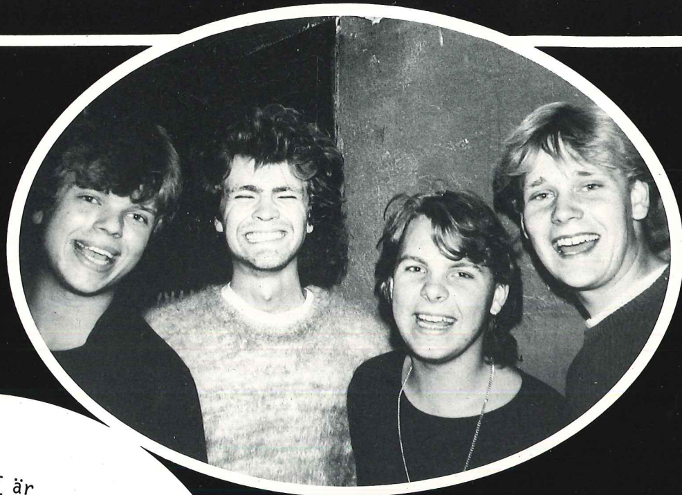
ATTENTAT är ett band som just har kommit med sin debut-LP. Gruppen spelar typisk Göteborgsrock; alltså ösig, svängig rockmusik med jordnära texter som gjort gossarna till publikfavoriter hos den unga publiken.