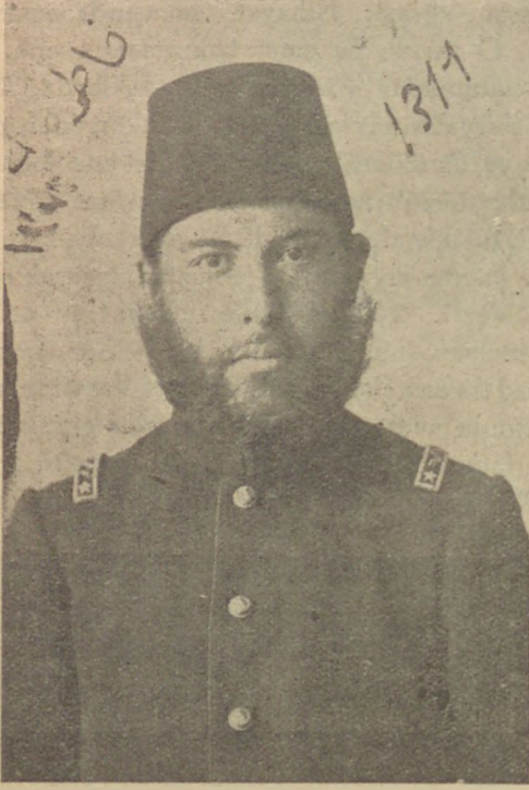
Tabbiyeden çıktıktan sonra 1310 de

Meşrutiyette Mısırdan vatanına dönen Abdullah Djevdet memleketinin büyük makamlarına kadar ağlarını uzatan batıl fikirler, taassup örüm-