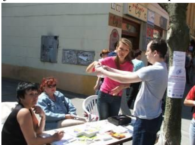
pracovníčky Ústavu verejného zdravotníctva pri meraní tuku

vyskúšali aj ďalší prítomní športovci ako aj prítomné deti. Jarným slniečkom zaliate Mierove námestie vytvorilo podmienky aj pre ďalšie športové aktivity. A tak na rôznych jeho miestach sme zaznamenali pohybové aktivity tretiačok zo Základnej školy sv. Svorada a Benedikta, ktoré skákali cez gumu a ďalšie dievčatá skúšali skákanie cez švihadlá. Veľký rešpekt si získali deti z Materskej školy Trenčín, Kubranská ulica, ktoré na otázku, ktorú z disciplín už absolvovali, že zatiaľ žiadnu. Odpoveď na otázku doplnili doprevádzajúce pani učiteľky : „Do centra mesta sme prišli so svojimi deťmi pešo z Kubrej. Takže prvú časť športovej aktivity majú už deti za sebou. Ešte pred odchodom do mesta deti si vytipovali súťaženie v skákaní vo vreciach a preťahovanie lanom pred Domom armády. Túto súťaž však organizátori vynechali. Tak skúsime prekonať chôdzou farské schody, ukážeme Trenčiansky hrad a potom pôj-