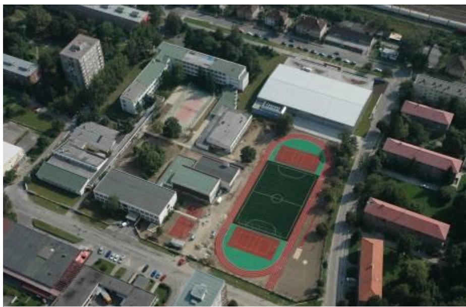
letecký pohľad na nový športový areál

Nový viacúčelový športový areál na Základnej škole