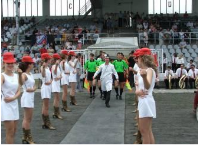
nástup futbalistov Trenčína a Utrechtu na trávnik

Kto nestihol oslavu dňa detí 4. júna 2005 dopoludnia v cen-