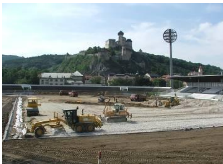
miesto futbalistov a po štadióne prehánali buldozéry, či iné stroje

Kongres UEFA schválil v apríli v estónskom Talline možnosť hrať od sezóny 2005–2006 majstrovské, medzinárodné a pohárové stretnutia vo futbale na umelej trávě. Tak vznikla myšlienka zrealizovať projekt s umelou trávou v Trenčíne priamo na mestskom štadióne.