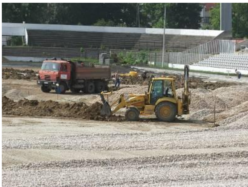
miesto futbalistov a po štadióne prehánali buldozéry, či iné stroje