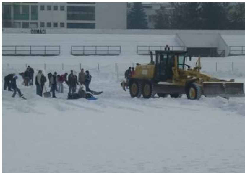
Ťažká práca bola práca pri odstraňovaní snehu na ihrisku i za pomoci mechanizmov

Bohatá snehová nádielka robila naozaj nemalé problémy nielen poľnohospodárom, ale aj vrcholovým futbalistom, ktorí už počas uplynulého víkendu dňa 5. marca 2005 mali odštartovať jarnú časť najvyššej súťaže. Príroda je však proti a