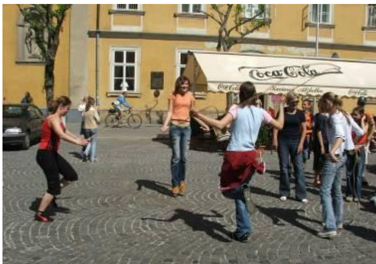
dievčatá cvičili so švihadlami