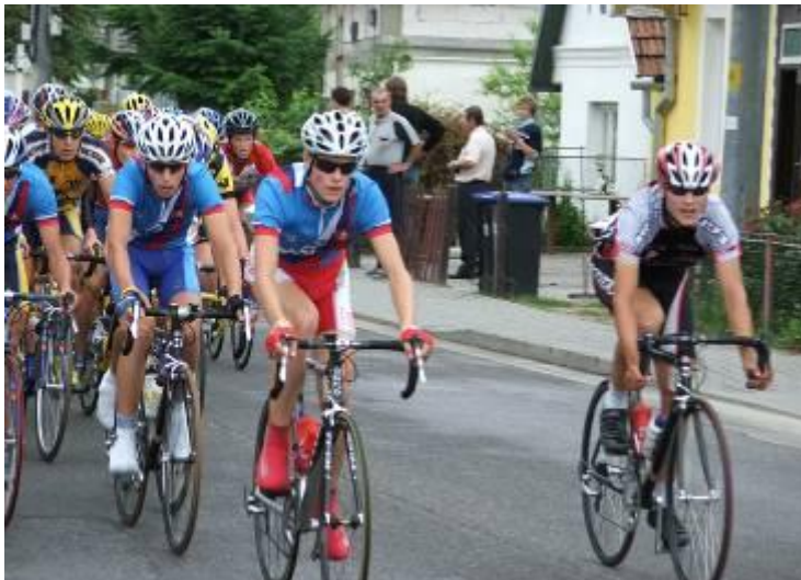
Okruh Orechové – Hrabovka – Skalka cyklisti absolvovali približne za 25 minút

Od piatku 22. júla do nedele 24. júla 2005 sa na cestách Trenčianskeho kraja uskutočnili štvoretapové medzinárodné cyklistické preteky „Cena Slovenska 2005“. Na podujatí sa okrem slovenskej reprezentácie predstavili aj družstvá mladých cyklistov z Ukrajiny, Slovinska, Maďarska, Poľska, Ruska, Lotyšska a Česka.