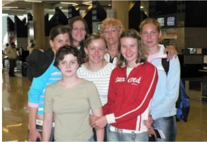
pretekárky so svojou trénerkou

vaním slovenských ľudových pesničiek „Trenčín dolinečka“ a „Keď si šťastný tleskaj rukami...“, čím si získali srdcia prítomných. Vybavení dostatkom propagačných materiálov o meste Trenčín a Slovenska, ich rozdaním spropagovali naše mesto a Slovensko medzi svojimi športovými priateľmi.