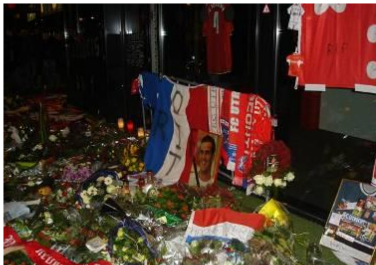
takto si uctili predčasnú smrť mladého futbalisti obyvatelia Utrechtu

nými semaformi, ktoré sa vinú doslova celým mestom. Súčasťou návštevy bolo i predstavenie futbalového štadióna FC Utrecht. Táto športová aréna, otvorená v roku 2002 má v takmer štvrtmiliónovom meste multifunkčné využitie. Návštevník pohybujúci sa v jej blízkom okolí, alebo v jej útrobach len veľmi ťažko spozoruje, že je na futbalovom štadióne. Všetky štyri tribúny z exteriéru pripomínajú bežné budovy využívané ako obchodné centrá, business centrá, administratívne a kancelárske priestory, konferenčné priestory, ba dokonca i priestory využívané na kultúrno – spoločenské akcie. „Interiér to len potvrdzuje. Súčasťou štadióna je dokonca i galéria a múzeum. Veľmi zaujímavá poloha štadióna trenčianskeho prvoligového futbalového klubu je priam predurčená na podobné multifunkčné využitie, ktoré by napomáhalo k ďalšiemu rozvoju mesta ako centra regiónu. Z tohto pohľadu je dnešné využitie areálu ležiaceho v širšom centre mesta nielen kvôli jeho jednostrannému