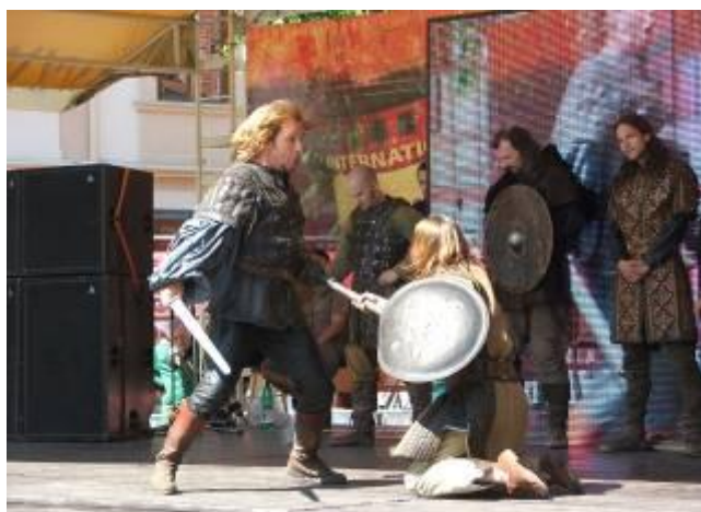
ukážka bitky stredovekých rytierov

Jednou so sprievodných podujatí Art-Film-u v Trenčíne