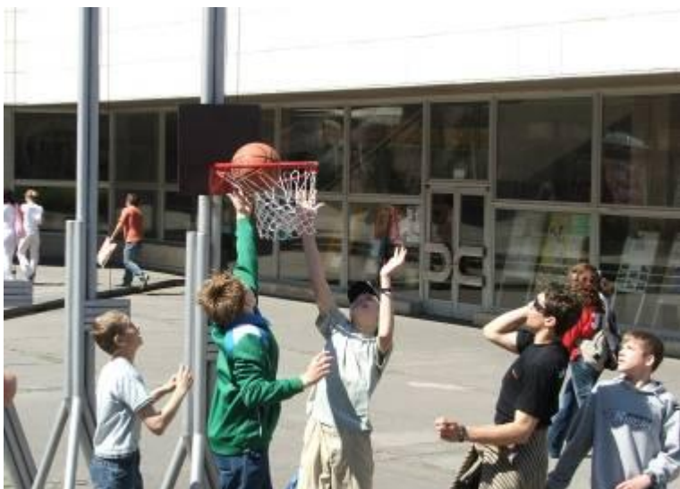
Pri KaMC OS SR sa hral basketbal na otvorenej scéne

ludnia Mierové námestie v Trenčíne, aby sa aktívne zapojili do pohybových aktivít v rámci „Dňa výzvy“ a pomohli tak mestu Trenčín k víťazstvu nad mestom Poprad. V rámci celého mesta Trenčín bolo pre tento účel rozmiestnených