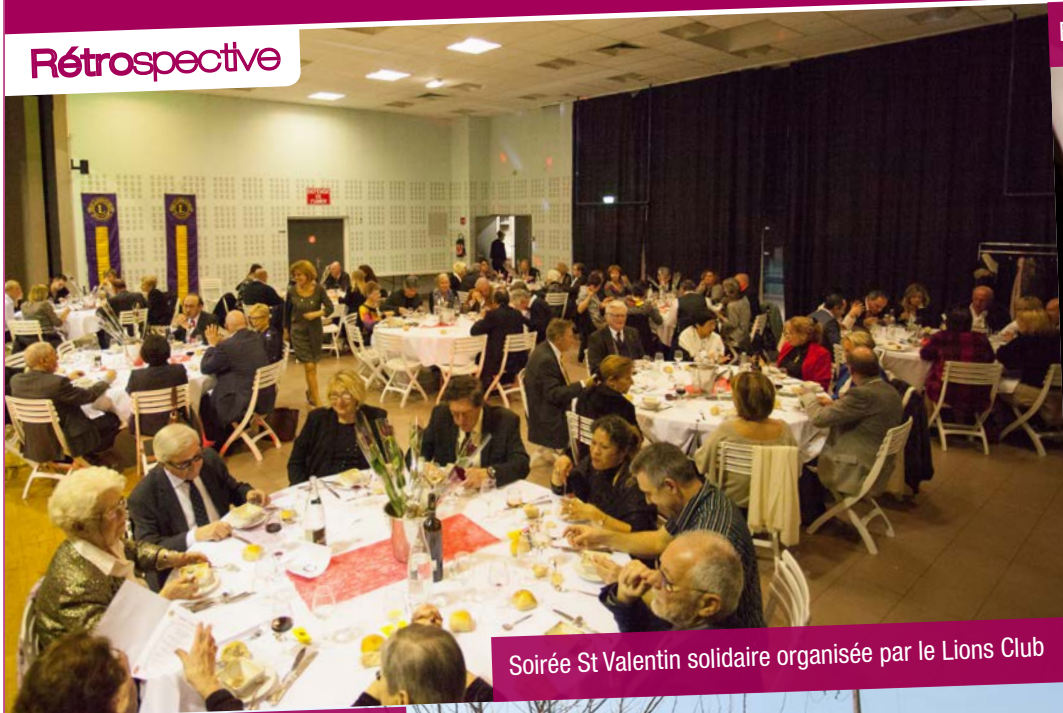
Soirée St Valentin solidaire organisée par le Lions Club