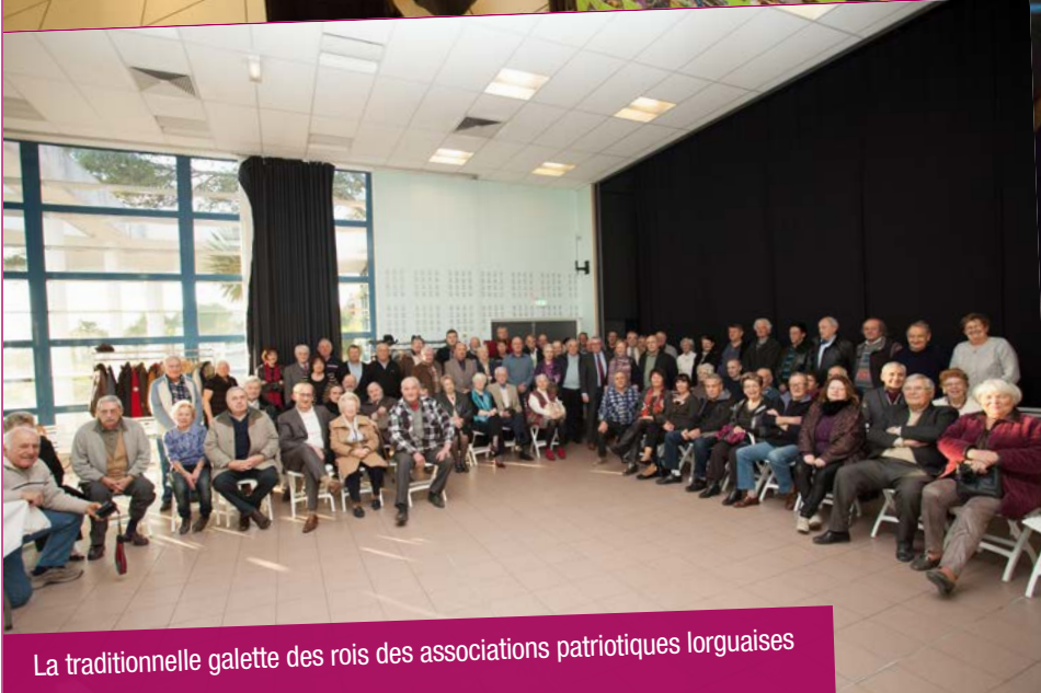
La traditionnelle galette des rois des associations patriotiques lorguaises