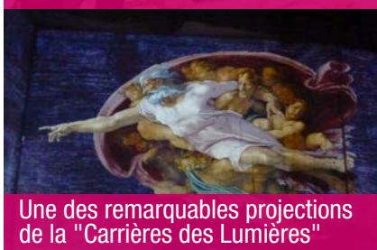
Une des remarquables projections de la "Carrières des Lumières"

gues du 18 ème siècle en action. L'après-midi fut un moment magique d'immersion dans l'art de la Renaissance aux « Carrières de lumières » des Baux de Provence, ancienne carrière désaffectée, support d'un extraordinaire spectacle de son et lumières. Une technologie innovante permet