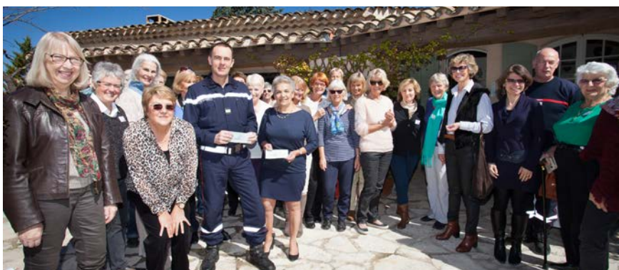
Remise de chèques aux représentants des pompiers et de la Ligue contre le Cancer

Samedi 21 mars, partis tôt le matin en autocar, ils ont d'abord visité la basilique Sainte-Marie-Madeleine à St-Maximin. Cet impressionnant monument gothique est le premier édifice religieux du Var, devant notre collégiale ; c'est aussi le troisième tombeau de la chrétienté après Jérusalem et St-Pierre de Rome. Depuis le moyen-âge, cette basilique était une étape importante pour les pèlerins sur la route de Rome, puisqu'elle abritait une relique de Marie-Madeleine, que d'ailleurs le conférencier leur a montrée dans la crypte. Ils ont aussi pu admirer les grandes or-