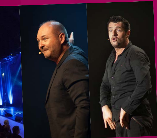
Cauet - Arnaud Ducret : les Fest'Hiver se terminent en éclats de rire !