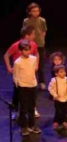
Les enfants m