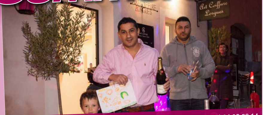
■ Art Coiffure - Homme- Femme-Enfant - 19 rue du Dr Courdouan - 04.94.85.20.14