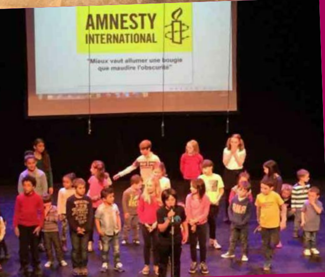
obilisés pour la soirée de sensibilisation d'Amnesty International