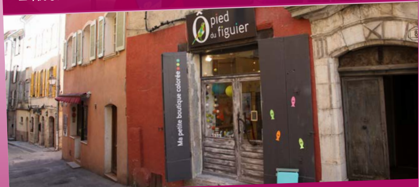
■ Ô pied du figuier - déco, chaussures, accessoires - 8 rue de la Trinité - 04.94.73.78.93