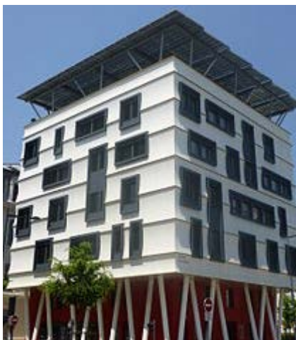
Vision d'un immeuble du futur