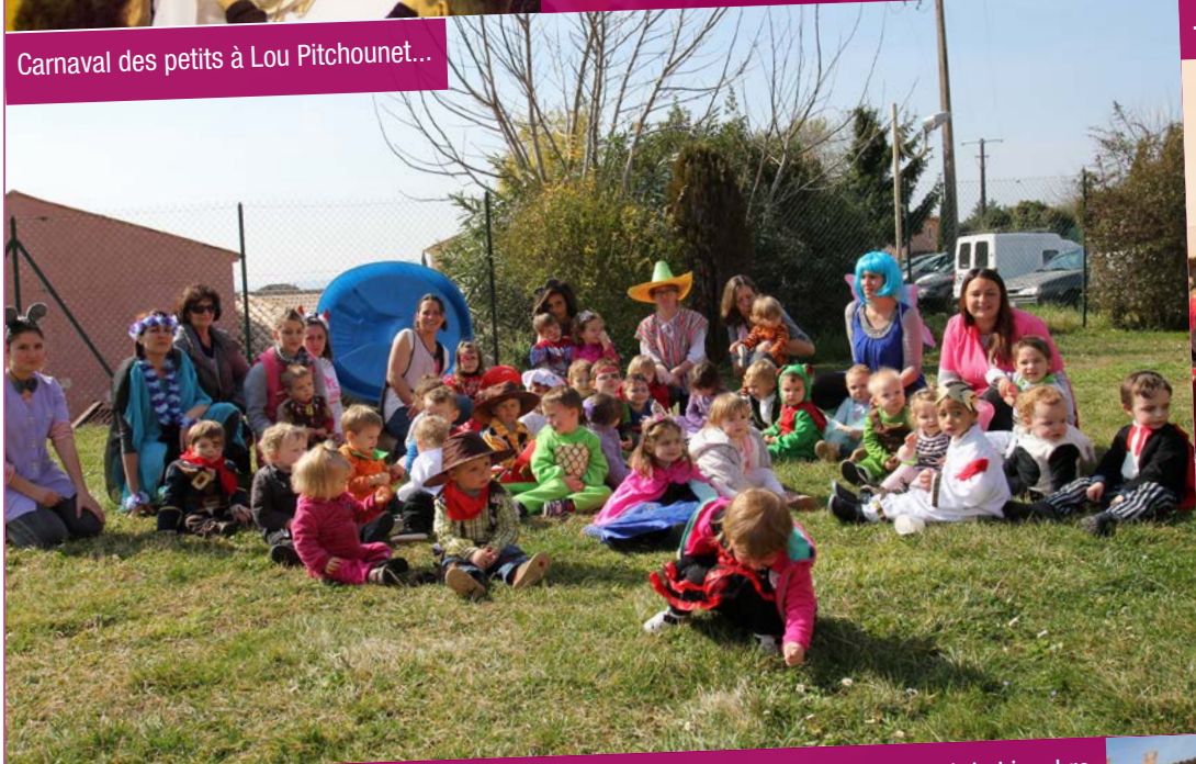
Carnaval des petits à Lou Pitchounet...