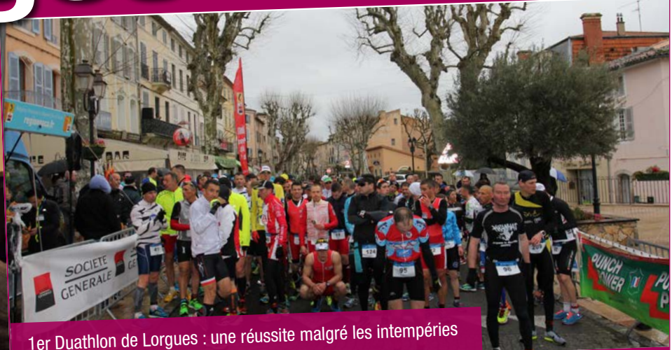
1er Duathlon de Lorgues : une réussite malgré les intempéries