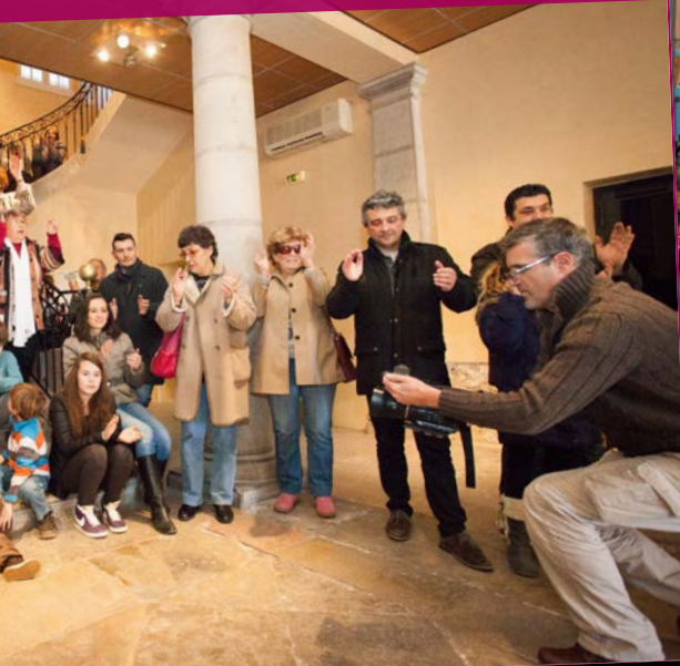
le" en hommage des victimes des attentats de janvier