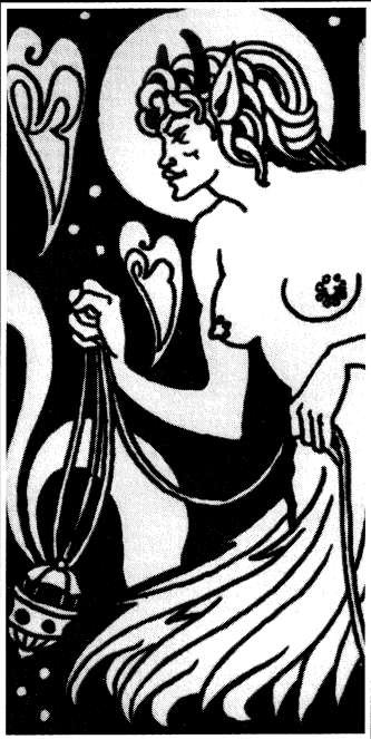
Aubrey Beardsleyren "Morte d'Arthur" liburuko irudia, 1893. Deabusak sorgindurik zabaltzen du intsentsua.

Hassan bitartekari hutsak ziren. Hassanek uste zuen bera Aurrendaria zela, lurra berdintzen duen hura Denboraren imana hartzeko prestatua egon dadin (Maalouf, 2002:127). Egipton ikasi zituen teknikei esker, Hassanek zalantza sortu zuen bere jarraitzaileen buruetan. Zenbat eta nahastuagoak zeuden, orduan eta Hassanen menpekoago ziren, fede eta obediencia itsuaren bidez bakarrik ziurta zezaketen salbamendua. Konbertituek beren familiak uzten zituzten Hassani jarraitzeko. Ulemek madarikazioak eta eskumikuak botatzen zituzten sekta honen aurka. Eta sektaren aurkako asasinatzeak hasi ziren eta horien kontrako errepresaliak. Sektak printze batzuk eta zenbait hiri konbertitzen ditu baina Nizamek egoera kontrolatzen du eta Hassan garaitzen du. Honek irakaspen bikaina ateratzen du guzti honetatik, boterearen aldeko borroka baliabide konbentzionalekin (armadekin) galdua dago. Horrela hasiko da bere gerralanabes berria sortzen, zein Asasinoen ordena izango baita.