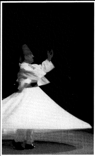
Dervitxeak, dantza eta musika ezagumena aldatzeko.