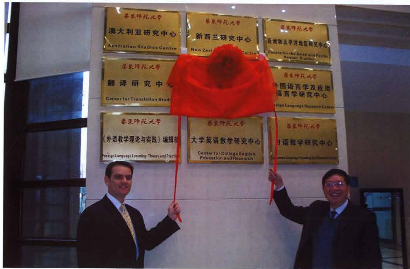
上海华东师范大学（ECUN）美国研究中心硕士班开班剪彩仪式