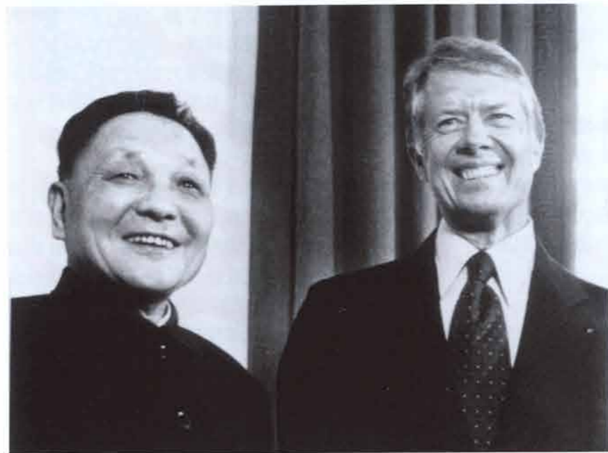
中国国务院副总理邓小平(左)和卡特总统于1979年1月在白屋椭圆形办公室向新闻记者谈两国新的外交关系。