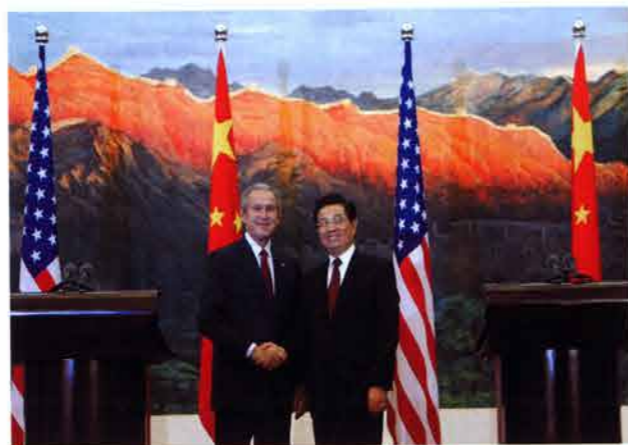
2005年11月20日，乔治·布什(George W. Bush)总统(左)在北京人民大会堂会晤中国国家主席胡锦涛。布什此次国事访问旨在推动自由与民主，同时讨论两国间紧迫的经济问题。