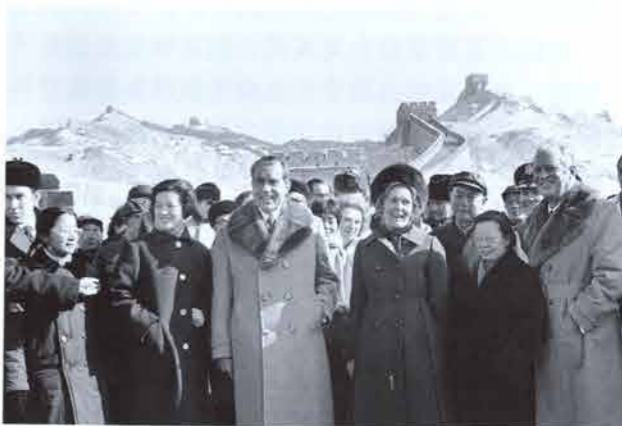
1972年2月24日，尼克松总统与夫人在中国的长城上与中国群众合影。

1971年7月，各国发现基辛格刚刚结束出访中国的秘密使命。尼克松宣布，他已经以美国总统的身份接受了访华邀请。同年8月和9月，美国首次支持新中国代表出席联合国安理会，同时象征性地支持台湾代表保留席位的努力。由于基辛格决定在此时访问北京，美国支持两个代表团的提议失败了。阿尔巴尼亚代表提出的由新中国代表取代台湾代表的提议轻松通过了。这是美国最容易接受的外交挫折之一。美国政府距离“一个中国”政策更近了一步。