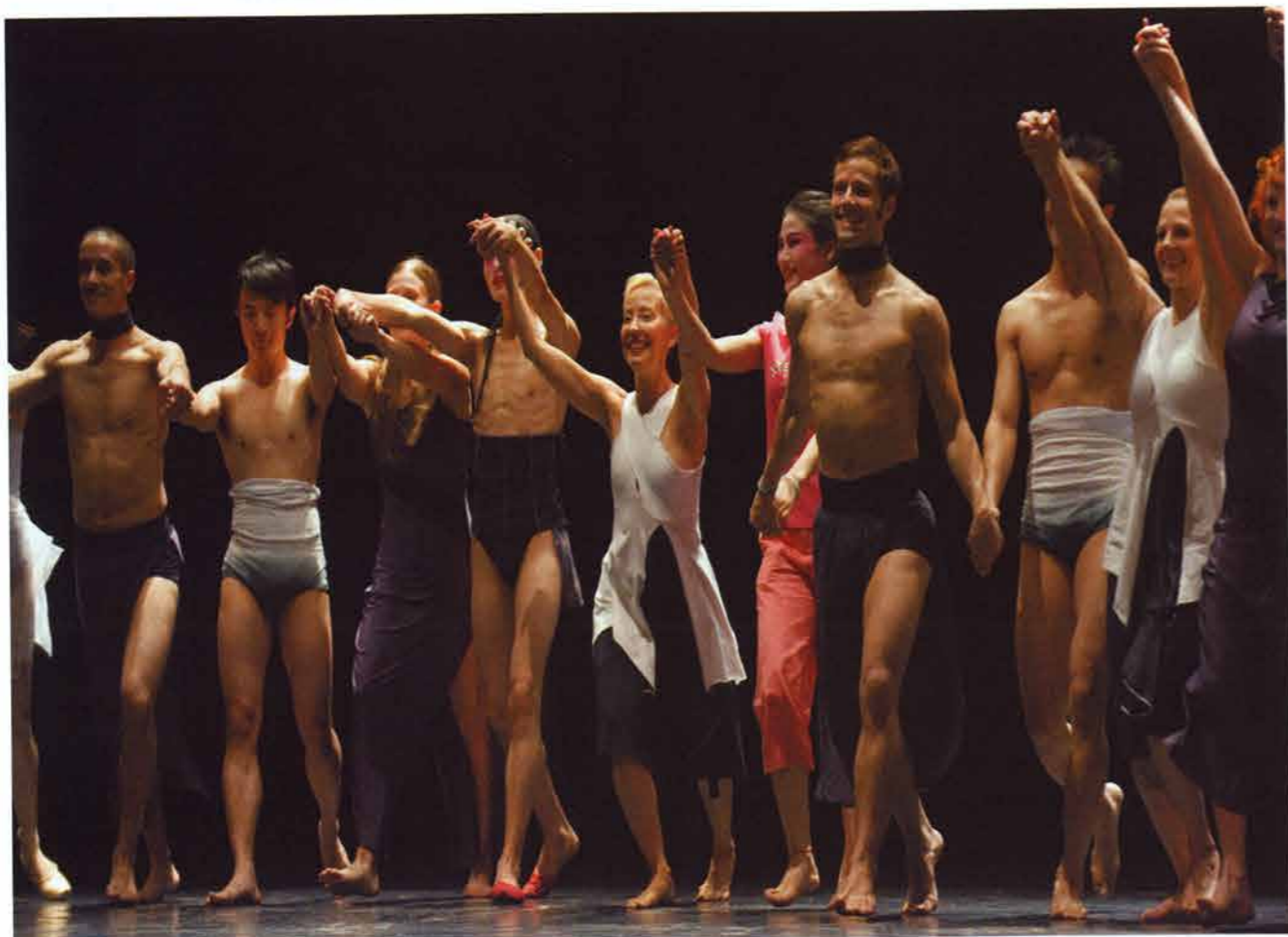
2008年北京奥运会期间，两个美国舞蹈团和三个中国舞蹈团在中美现代舞蹈节上进行为期一周的表演。