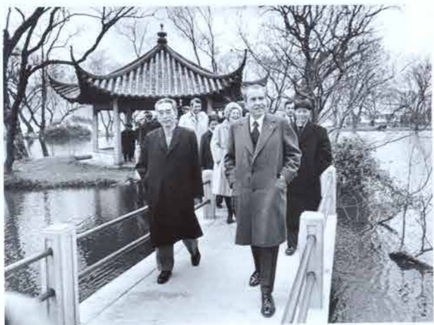
1972年，尼克松总统与夫人在中国总理的陪同下漫步桥上。

作者：孔华润 Warren I. Cohen 2006年4月1日 America.gov