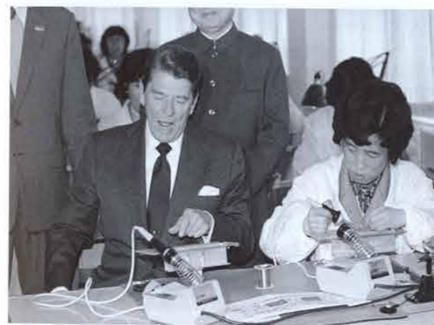
1984年4月30日，罗纳德·里根(Ronald Reagan)总统(左)在上海参观福克斯波罗(Foxboro)工厂时手指一块他焊接的印刷电路板。右侧为该工厂的一名工人。