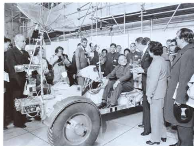
中国副总理邓小平(中)在1979年2月2日访问位于德克萨斯州休斯敦的约翰逊航天中心时乘坐月球车模型。邓小平是在中美关系正常化之际访问美国的。