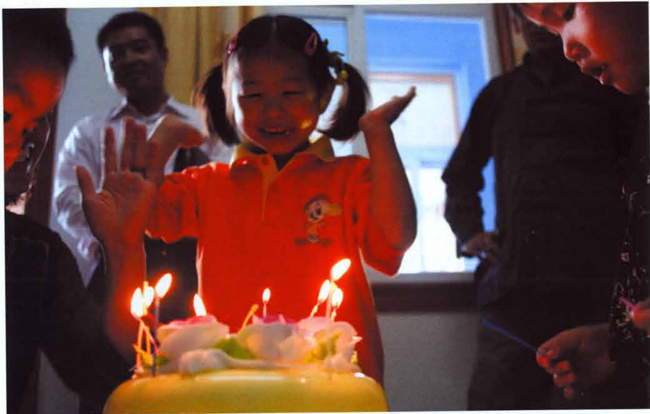
和属于自己的家人一起开生日宴会

我们希望：我们帮助的所有孩子能和世界上其他孩子一样——感受到安全、关爱和重视。这些孩子虽然衣食无忧，但因为缺乏足够的个体亲情关心与呵护，普遍存在着各种身心发展问题。我们希望帮助他们充分挖掘自身潜能，更好地应对成长发育和情感发展方面的各种挑战。”