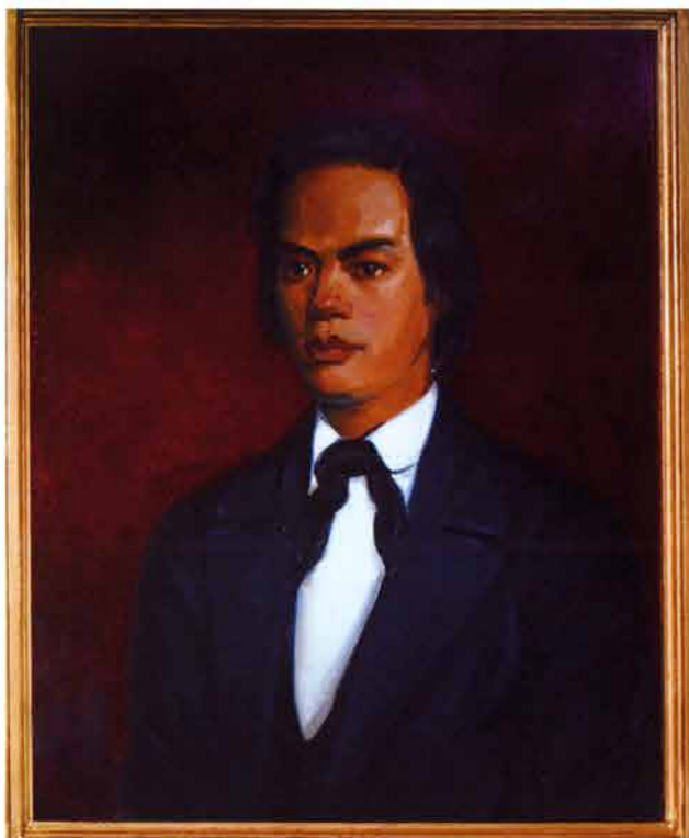
容闳，1870年就读于耶鲁大学的一名中国留学生

节选自《共同之旅：200年历史》 (2008年8月商务部历史学家办公室出版的一本历史书)