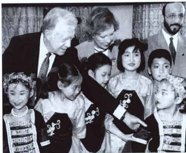
1991年，前总统卡特(左上)和前第一夫人罗莎琳卡特(Rosalynn Carter, 后中)参观北京第一聋哑学校。图为卡特夫妇招呼为他们演出的一些中国学生一起合影留念。