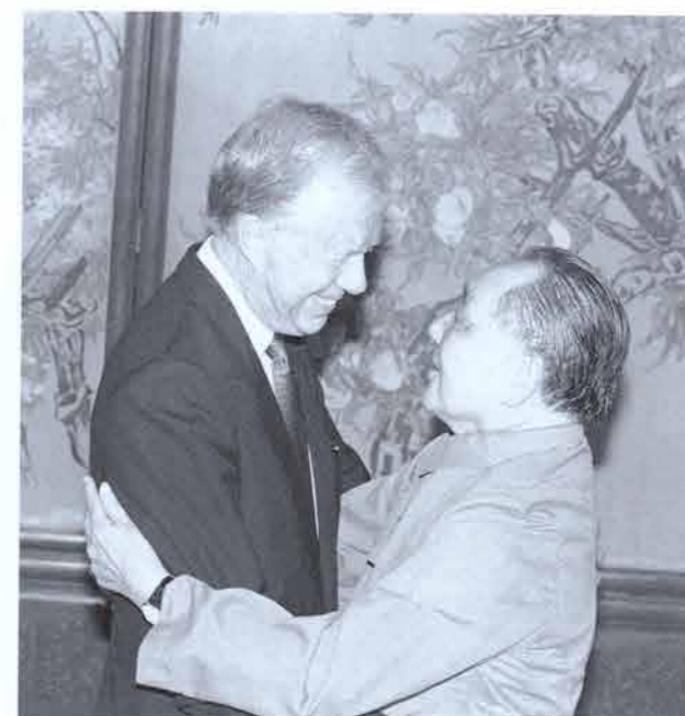
1987年6月29日，前总统卡特在对中国进行私人访问时与中国最高领导人邓小平拥抱。