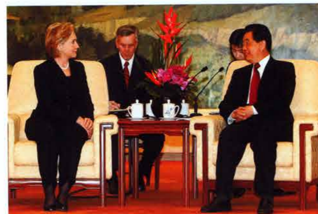
2009年2月21日，国务卿希拉里·克林顿(Hillary Rodham Clinton, 左)访问东亚四国期间会晤中国国家主席胡锦涛。克林顿国务卿与胡主席就如何稳定全球经济的方法、气候变化和加强东北亚地区的安全展开讨论。