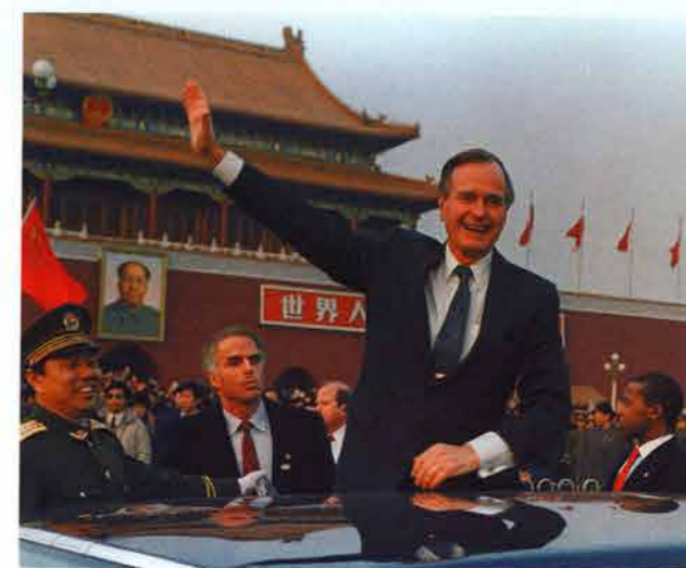
1989年2月25日，乔治·布什(George H. W. Bush)总统(中)在北京天安门广场向人群挥手。布什身后是曾为中国历代帝王居所的紫禁城的大门。布什早年曾担任美国驻华代办主任。