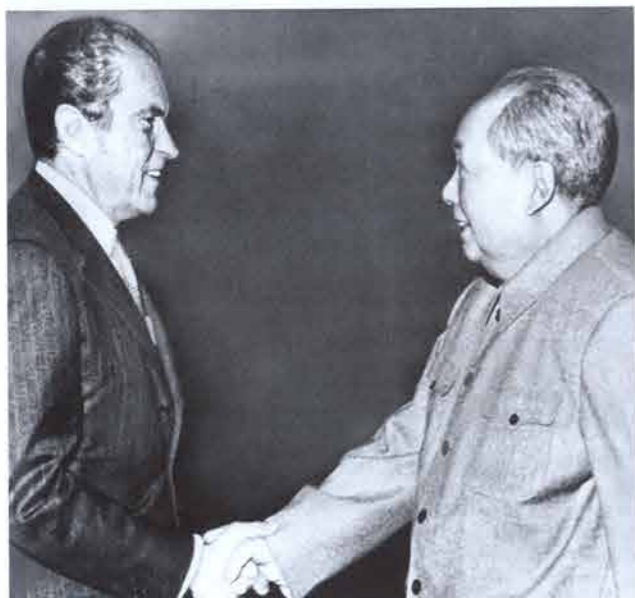
尼克松总统(左)于1972年2月21日在对中国进行的破冰之旅中会晤中国共产党领导人毛泽东(右)。这次访问最终导致两国恢复正式外交关系，使冷战时期的国际关系格局发生重大改变。