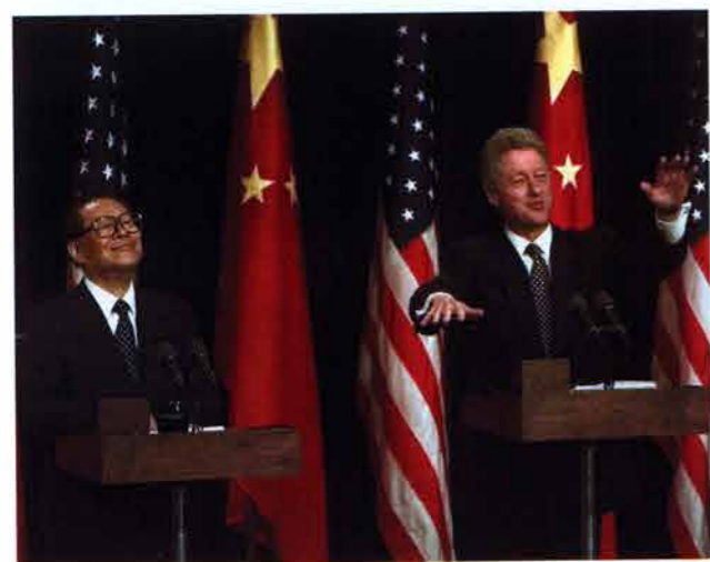
1997年10月29日，克林顿(Clinton)总统(右)在华盛顿与中国国家主席江泽民举行联合新闻发布会。克林顿和江泽民在会上就自由、民主、不同政见和宗教自由等问题进行了热烈答辩。