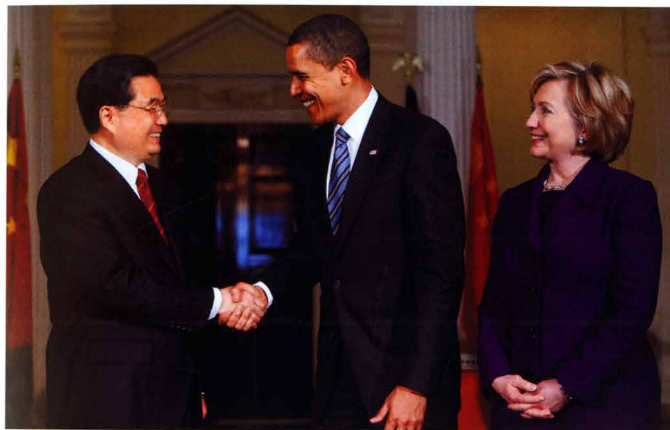
2009年4月，美国总统巴拉克·奥巴马(Barack Obama)、国务卿希拉里·克林顿和中国国家主席胡锦涛在伦敦举行的G20金融峰会上拨冗会晤。两国首脑就中美关系和双方共同关心的全球问题广泛交换了意见。