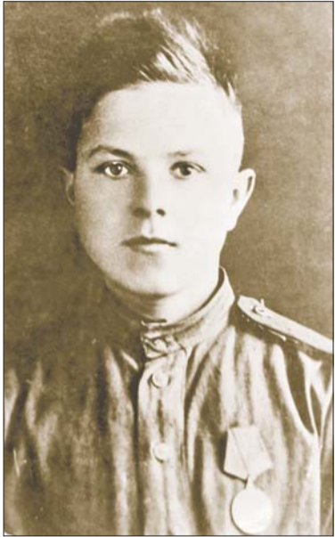
В сентябре 1943 года