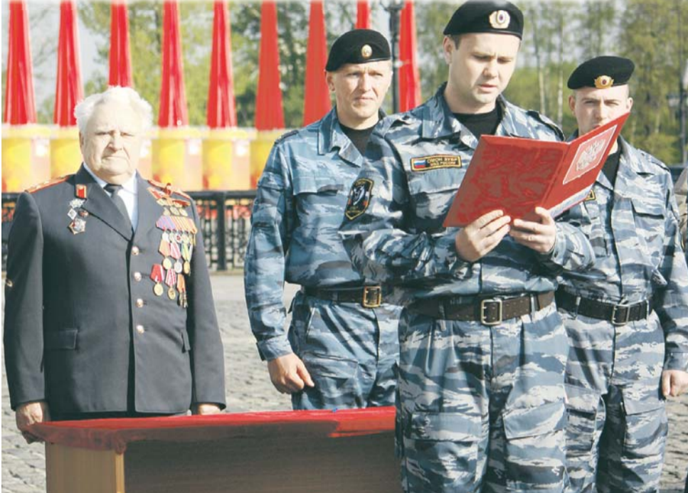
Присяга на Поклонной горе 7 мая