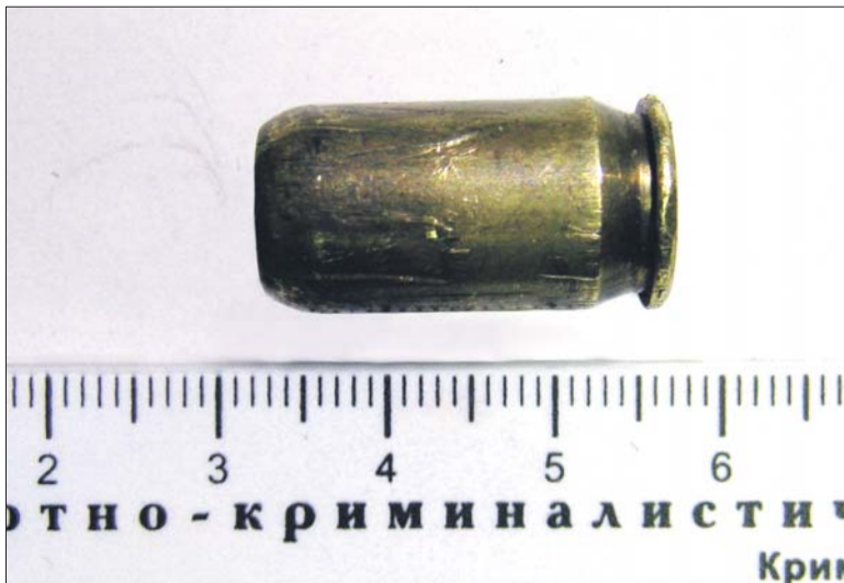
«Вещдок» на столе эксперта-криминалиста

бления магазина. Его фотографию они тоже показали свидетелям преступления, чтобы убедиться, что не ошиблись в своих предположениях. И снова это было точное попадание в цель. Если верить пострадавшим, 25-летний гражданин Азербайджана был не просто другом погибшего