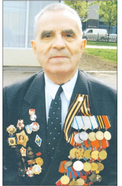
В мае 2015 года

Сейчас занимаюсь патриотическим воспитанием молодёжи. Утверждаю, что человек может жить и выживать в любой обстановке и при любых обстоятельствах. Только надо быть терпеливым, стойким и любознательным. А ещё - понимать и поддерживать людей. Фронтовики это отчётли-