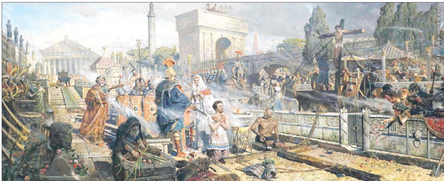
Павел Рыженко «Выбор веры. Святой мученик Георгий Победоносец»

ды, когда некоторые люди стали забывать подвиги своих предков-фронтовиков.