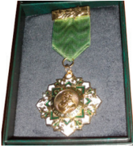
“Dədə Qorqud” Milli Xeyriyyəçilik Fondunun “Vətən övladı” qızıl medalı -18 oktyabr 2012