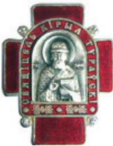
Belarus Pravoslav Kilsəsinin I dərəcəli “Svyatitel Kiril Turovski” ordeni - 17 noyabr 2013-cü il