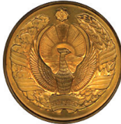
Daşkənd İslam Universitetinin qızıl medalı - 21 aprel 2011