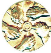
“Krans Montana” Forumunun qızıl medalı - 19 oktyabr 2013