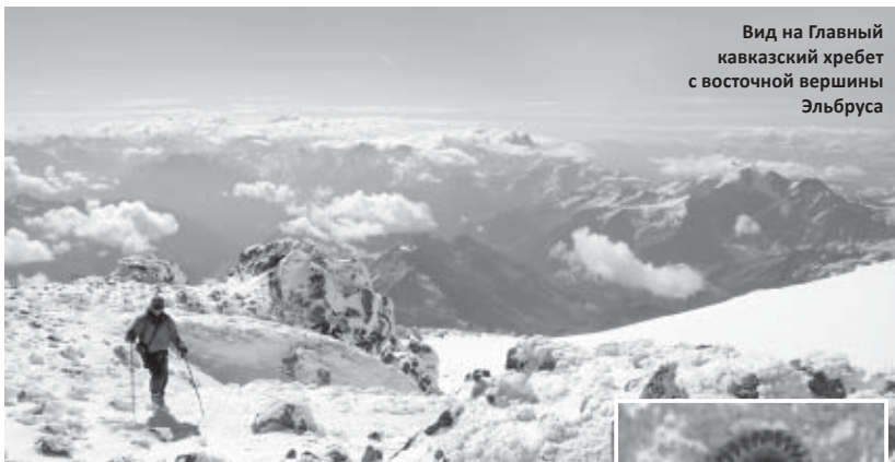
Вид на Главный кавказский хребет с восточной вершины Эльбруса

Созерцая фотокартины, на которых запечатлены самые отдаленные уголки республики, места, настолько редко посещаемые, что кажутся необитаемыми, понимаешь: фотограф — это охотник. Только его цель — остановить мгновение.