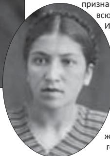
▲ ГИТИС. Москва, 1939 г.