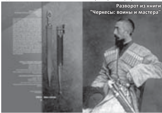
Разворот из книги «Черкесы: воины и мастера»

— Постоянно, как и всякому работающему человеку. А вам разве нет?