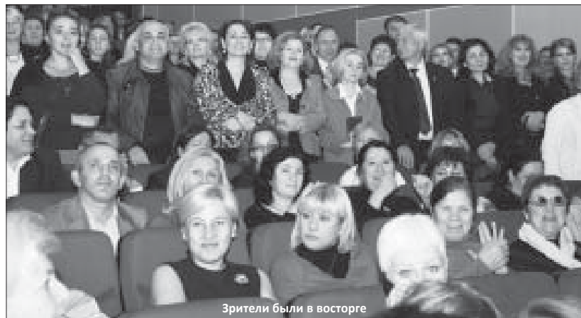
Зрители были в восторге

Ближе к концу у артистов и зрителей установилось такое взаимопонимание, что песню «Ямщик, не гони лошадей», а также одну из неаполитанских песен зал исполнил вместе с мэтром. Зрители долго не хотели отпускать артистов и устроили овации. А поскольку в зале было много молодежи и даже детей, этот вечер, без сомнения, не только запомнится надолго, но, возможно, сыграет свою роль в формировании культуры будущих поколений.