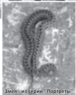
Змея - из серии "Портреты"

насколько я понимаю, есть не только старые фото, сделанные в XIX-XX веках, но и стилизованные снимки с современными моделями. Однажды в интервью «Горянке» вы сказали, что снимать современных людей очень сложно. Почему?