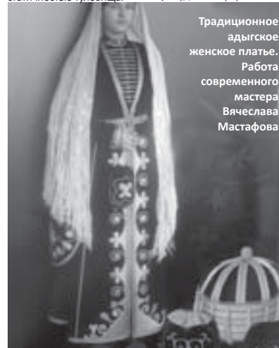
Традиционное адыгское женское платье. Работа современного мастера Вячеслава Мастафова

Своеобразной деталью кабардинского костюма были подвесные рукава. Отличаясь большой декоративностью, они привлекают внимание к выразительности жестов рук по контрасту со статичностью туловища.