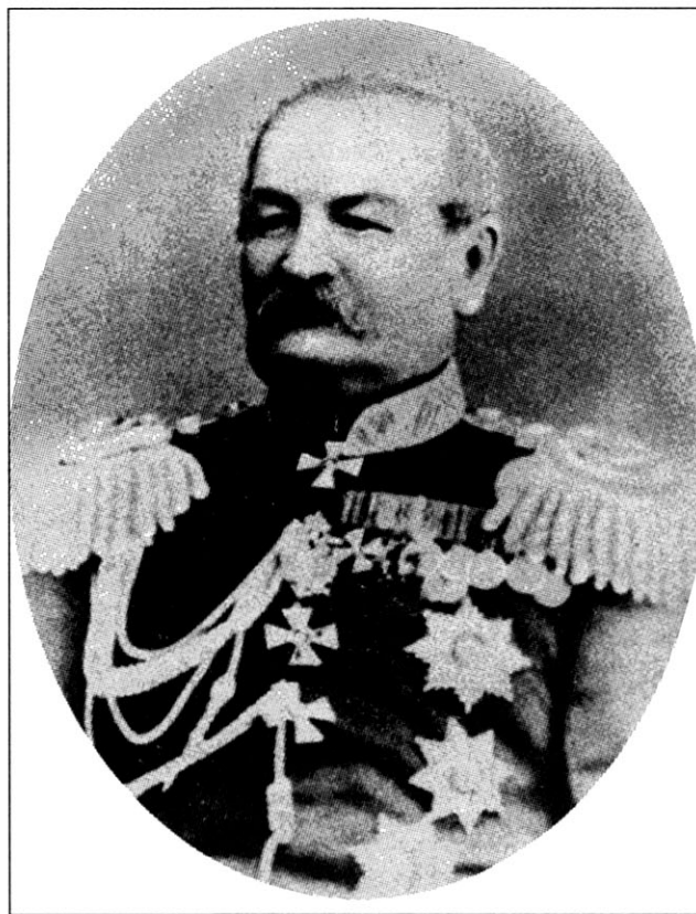
Генерал-лейтенант, с 1869 г. генерал от инфантерии А.П. Хрущёв, командующий войсками Западного Сибирского военного округа в октябре 1866 — январе 1875 г.

По официальным данным за 1870 год, на действительной службе от Сибирского казачьего войска в Сибирском военном округе находились уже только 8 конных сотен, а также 1 учебная сотня и 3 пешие команды. Здесь нужно отметить, что части этого войска почти постоянно находились и на территории Туркестанского военного округа. В этот период —