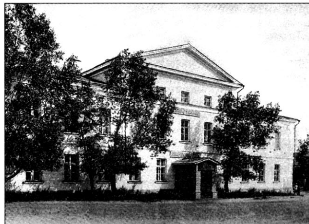
Здание Военного собрания в г. Омске (построено в 1861 г.)

2-й этап (август 1864 г. — начало 1865 г.). С введением 6 августа 1864 года в действие «Положения...» были созданы ещё 5 военных округов: Петербургский, Финляндский, Харьковский, Московский и Казанский, а также начата унификация системы управления уже существовавших военных округов 2 . При этом продолжалась доработка «Положения...» для возможности применения его к остальным, ещё