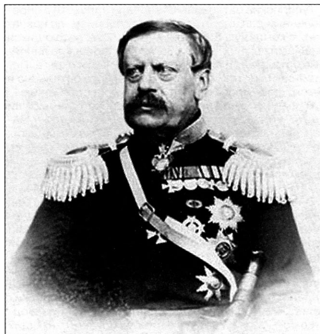
Генерал от инфантерии А.О. Дюгамель, командующий войсками Западного Сибирского военного округа в апреле 1865 г. — октябре 1866 г.

На месте реформа была проведена летом — осенью того же 1865 года. С открытием новых управлений ликвидировались старые военно-административные органы: штаб войск Западной Сибири, управления начальника артиллерии Западной Сибири, конно-артиллерийской бригады Сибирского казачьего войска,