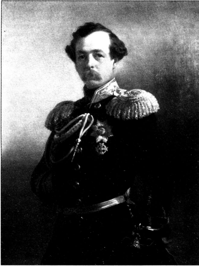
Генерал-лейтенант, с 1878 г. генерал от кавалерии Н.Г. Казнаков, командующий войсками Западного Сибирского военного округа в январе 1875 — феврале 1881 г.

Усть-Каменогорск и Каркаралы (Каркаралинск) были сформированы местные команды. Первую (Барнаульскую) подчинили Томскому губернскому воинскому начальнику и начальнику штаба Западного Сибирского военного округа на правах начальника местных войск Тобольской и Томской губерний, а последние три — военному губернатору и командующему войсками Семипалатинской области на правах начальника местных войск, исполняющего вместе с тем и все обязанности губернского воинского начальника. Не было забыто, чтобы знамя Алтайского горнозаводского батальона, «Всемиловнейше пожалованное в 1838 году бывшему 10-му Сибирскому линейному батальону, а до того времени принадлежавшее с 1711 года Московскому гарнизонному полку», было передано для хранения в соборный храм Барнаула 35 .