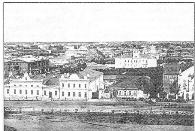
Панорама Омска в начале XX в.

В силу специфики округа значительным было количество местных и конвойных команд: 35 местных и 9 конвойных 10 . Несмотря на то что на территории округа располагалось 12 укреплений: Кокбектинское, Токмак, Верное (имело крепостное управление 2-го класса), Илийское, Каракольское, Нарынское, Копальское, Кастекское, Сергиопольское, Бахты, Борохудзин и пост