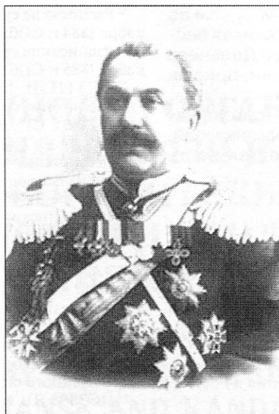
Генерал от кавалерии Е. О. Шмит, командующий войсками Омского военного округа в июне 1908 — мае 1915 г.