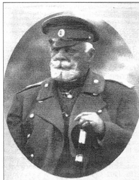
Генерал от кавалерии Н. А. Сухомлинов, командующий войсками Омского военного округа в мае 1915 — марте 1917 г.

корпусов Московского военного округа, и горную артиллерию из Сибири». В первом было отказано по причине отсутствия данных о неизбежности войны, а горную артиллерию, в которой Кавказ крайне нуждался, действительно перебросили из Иркутского и Омского военных округов 45 . Так, Сибирский резервный горный артиллерийский дивизион и Сибирский резервный горный артиллерийский парк были временно переброшены на Кавказ 46 .