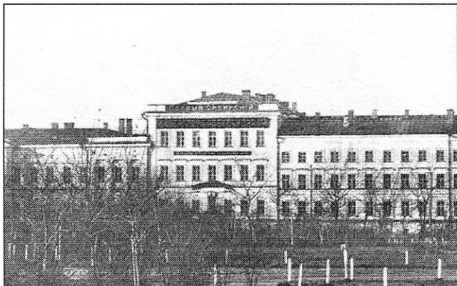
1-й Сибирский кадетский корпус в 1914 г.

Зайсанский, инженерных войск в нём в это время не было, а Западно-Сибирская сапёрная рота только «подлежала сформированию с 1 января 1884 г.». Зато имелись инженерные дистанции: Омская 2-го класса и Семиреченская 1-го класса 11 .