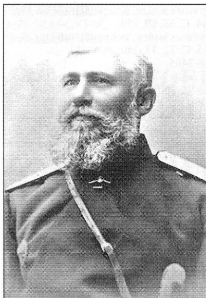
Генерал-лейтенант И. П. Надаров, командующий войсками Омского военного округа в апреле 1906 — июне 1908 г.