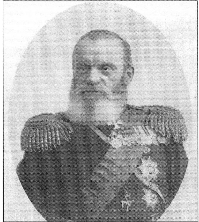
Генерал от кавалерии Г.А. Колпаковский, командующий войсками Омского военного округа в мае 1882 — октябре 1889 г.

По официальным данным на 25 декабря 1883 года, в Омском военном округе регулярные войска были представлены следующим образом. Пехота: 8 Западно-Сибирских линейных батальонов (1—2-й в Семипалатинской области, 3—8-й — в Семиреченской области) и 4 резервных пехотных кадровых батальона 5-ротного состава: Тобольский, Томский, Омский и Семипалатинский, дислоцировавшиеся в одноимённых населённых пунктах. Артиллерия: Западно-Сибирская (т.е. бывшая 2-я Туркестанская) артиллерийская бригада 4-батальонного состава: 1-я батарея — 8 конных пушек,