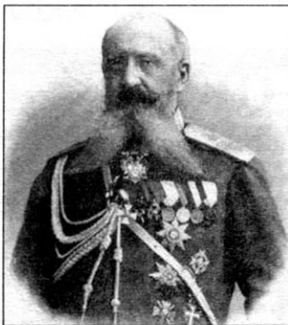
Первый командующий войсками Приамурского военного округа генерал от инфантерии А.Н. Корф