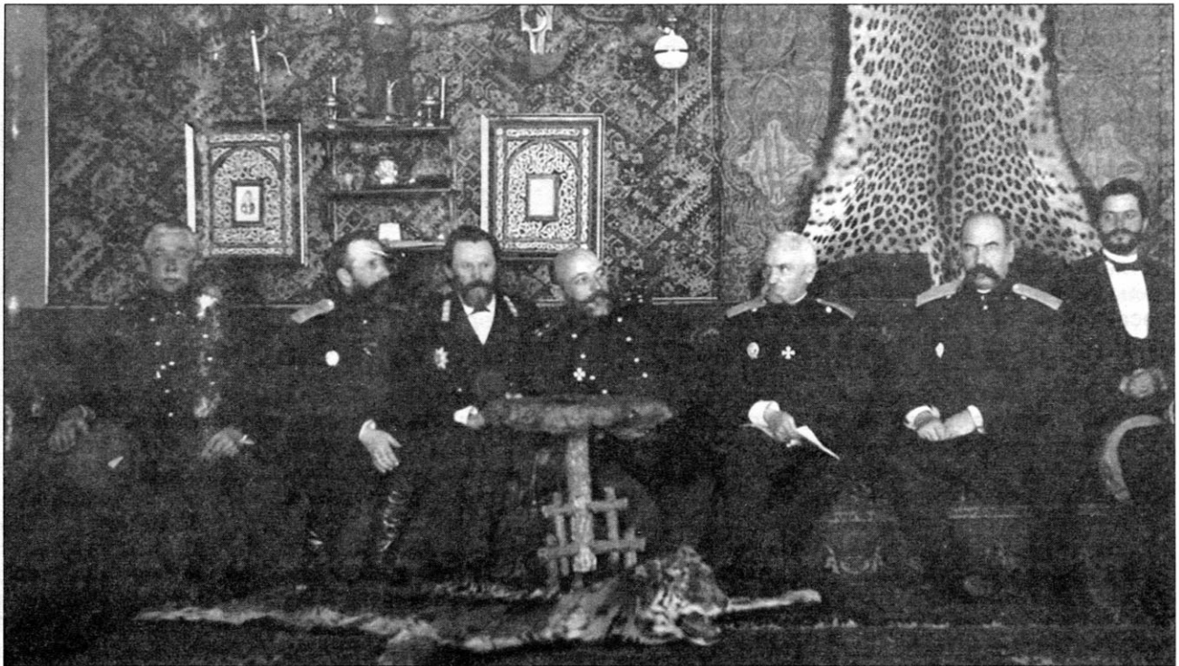
Редкое фото: в резиденции командующего войсками Приамурского военного округа находятся одновременно три генерала, в разное время занимавшие эту должность: 4-й слева — Н.И. Гродеков (1898—1902), 5-й — С.М. Духовской (1893—1898), 6-й — П.Ф. Унтербергер (1905—1910)

Первый командующий войсками округа — генерал-лейтенант А.Н. Корф, сразу столкнувшись с реальной военной опасностью — возможным противоборством с Китаем и Англией, в сентябре 1885 года писал военному министру П.С. Ванновскому: «С первого же взгляда на имеющиеся здесь военные силы и средства я пришёл к убеждению в неготовности вверенного мне округа для удовлетворительного решения помянутых задач» 18 . Вскоре после этого он совместно со штабом округа разработал обширную программу усиления российских войск в регионе. В 1885—1888 гг. происходила череда совещаний по её рассмотрению. В итоге Министерство финансов согласилось ежегодно в течение 5 лет отпускать Военному министерству суммы на покрытие постоянных расходов по усилению войск Приамурского военного округа. Реализация программы Корфа, которая была лишь минимальным набором необходимых мер, затянулась до 1895 года, когда очередное резкое ухудшение внешнеполитической ситуации в Восточной Азии заставило начать более ощутимое увеличение численности войск в округе 19 .