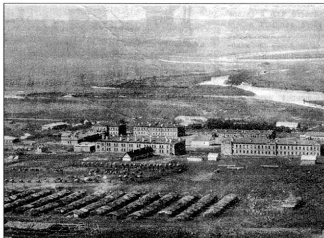
Село Раздольное Приморской области в 1908 г. Казармы 1-го Восточно-Сибирского стрелкового полка. На переднем плане шалаши 6-го Восточно-Сибирского стрелкового полка, зимовавшего в Раздольном в начале Русско-японской войны 1904—1905 гг.

Рост численности войск позволил оперативно и успешно силами Приамурского военного округа и войск Квантунской области осуществить в 1900—1901 гг. поход в Китай для ликвидации восстания ихэтуаней и стабилизации обстановки в стране (одновременно в Китай вводились английские, американские, немецкие и другие войска). Как раз