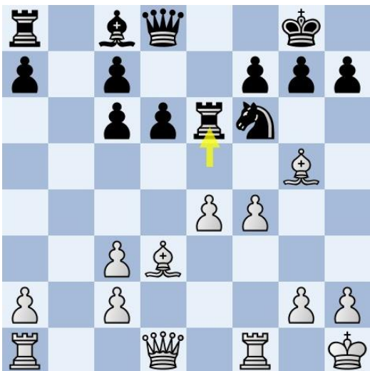
Diagram na 12.f4 ♖e6