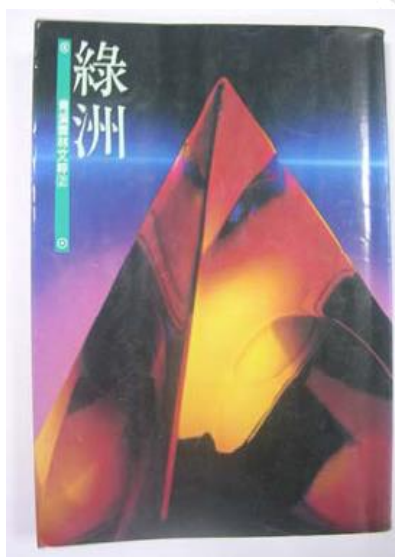
《綠洲—青溪雲林文粹 2》