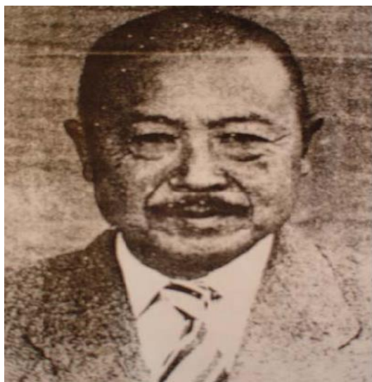
蔡秋桐（轉載自林亞卿：《雲林祕笈-沙墩元長》，雲林：雲林縣政府文化局，2005年）