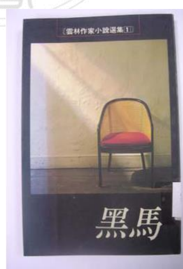
《黑馬—雲林作家小說選集（一）》