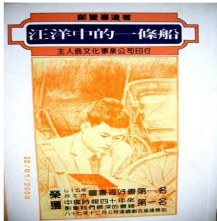
鄭豐喜《汪洋中的一條船》