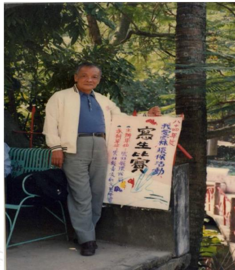
《彭徐文集》的封面