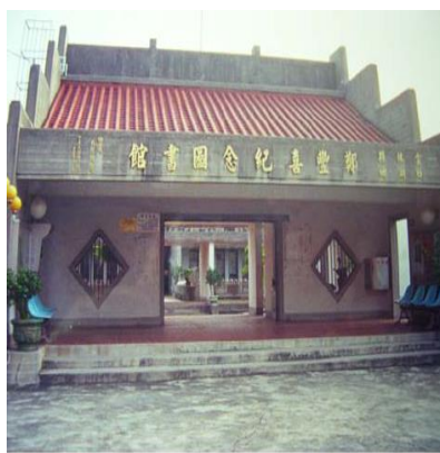
鄭豐喜紀念圖書館