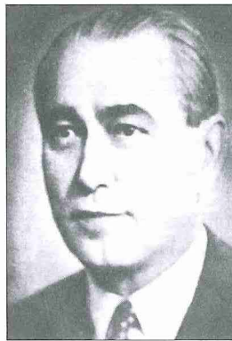
Ali Fethi Okyar

Bu denemeden sonra Fethi Bey'e yeniden Paris'e dönebileceği bildirildiyse de kabul etmedi. 7 Nisan 1934'te Londra büyükelçiliğine gönderildi. 1936'da İngiltere Kralı VIII. Edward'ın Türkiye ziyareti dolayısıyla İstanbul'a geldi. O yıl içinde imzalanan Montrö Boğazlar Sözleşmesi'nin Türk delegasyonu içinde bulundu. Atatürk'ün ölümünden sonra 1939'da ülkeye döndü. İsmet İnönü kendisiyle barışmak istedi ve onu Refik Saydam kabinesine Adalet bakanı tayin etti. Bu arada Bolu milletvekiliğine seçildi. 1942'de emekli oldu. Büyükkada'daki köşküne çekilerek hâtıralarını yazmaya başladı. Serbest Cumhuriyet Fırkası dönemine ait hâtıralarını kaleme aldı, fakat 1943 yılının başlarından itibaren hastalığı ilerledi. 7 Mayıs 1943 tarihinde İstanbul Nişantaşı'ndaki evinde öldü ve Zincirlikuyu Asrî Mezarlığı'na defnedildi.