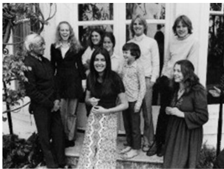
Krishnamuriti en studenten Brockwood house 1972 http://blog.brockwood.org.uk/2013/10/

Zelfbeheersing zit er ook in de lat net hoog genoeg te leggen om de uitdaging er in te houden, maar net niet te hoog, wat ertoe zou kunnen leiden dat de leerlingen afknappen. In tegenstelling tot de onderwijzers die veel voeling hebben met het niveau van de leerling, verwachten veel leraars en docenten dat de leerling in één of enkele jaren tijds hetzelfde inzicht in het vak verwerven als zijzelf hebben kunnen opbouwen in de loop van hun leven.