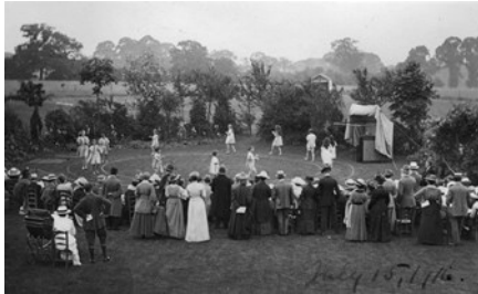
St. Christopher School - Oudersdag 1916 http://www.stchris.co.uk/about-us/history

St. Christopher School, onder leiding van de Theosophical Educational Trust in Great Britain and Ireland.