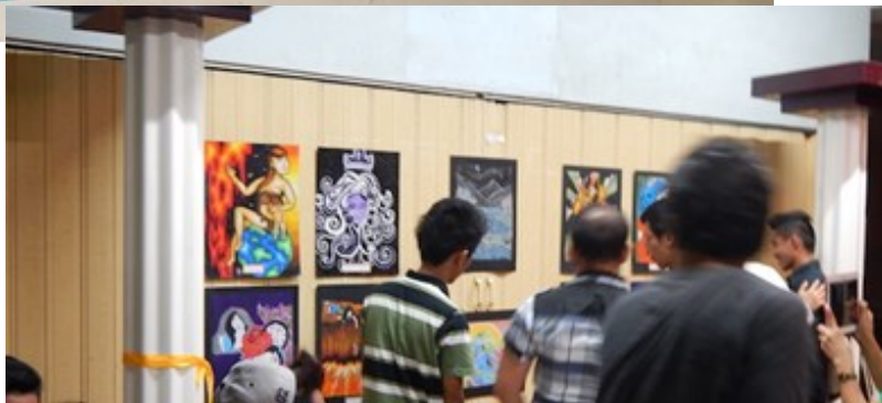
Tentoonstelling - kunstwerken studenten