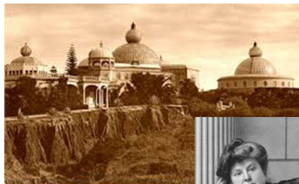
Point Loma www.sohosandiego.org