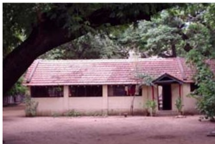
1894- gebouwtje eerste Panchama School, opgericht door Olcott. Later werd de school Olcott Memorial Panchama(Paraiyar) School genoemd. Een school voor de armen. https://en.wikipedia.org/wiki/Olcott_Memorial_High_School

Met Olcottscholen bedoelen we meestal de scholen die hij heeft opgericht voor de paria's, de kastelozen, die normaal geen scholen hadden en dus geen onderricht konden krijgen. We mogen niet uit het oog verliezen dat de kasten pas officieel werden afgeschaft in 1949, wat bovendien op het platteland nog steeds niet overal is doorgedrongen!