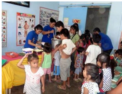
Lunch - soepkeuken

Als je een leraar Engels bent, wil je dan niet je beste vermogens ontdekken in taal – spreken, schrijven van verhalen of essays? Zou je een roman willen schrijven? Waarom niet? Of een schoolboek voor Engels?