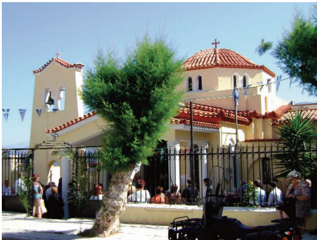
Από τη Θεία Λειτουργία στην Αγία Φωτεινή.

Τη συνεστίασή μας παρακολούθησε και μια δημοσιογράφος τοπικής εφημερίδας, που εξεπλάγη από το πνεύμα συναδέλφωσης και αγάπης που επικρατούσε μεταξύ μας και ζήτησε να πληροφορηθεί περισσότερα για τους