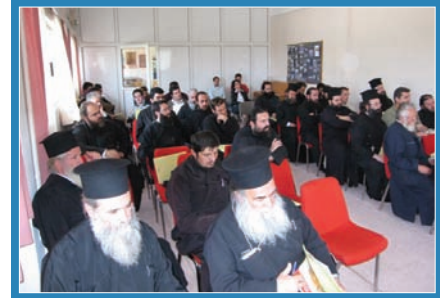
Από την εκδήλωση της 15ης Μαΐου.

Για το σκοπό αυτόν προτάθηκε να οργανώνονται τοπικές συναντήσεις-εκδη-