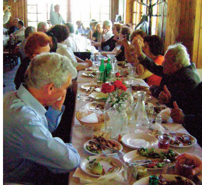
Από τη συνεστιάση στην ταβέρνα Καμαρέτα.