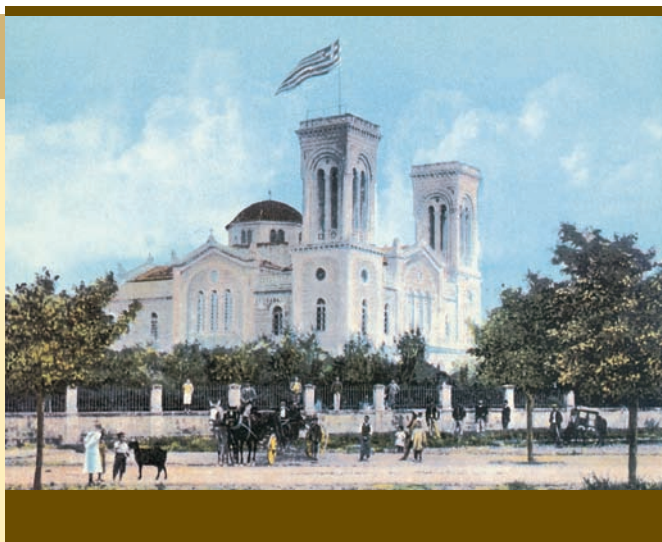
Ο καθεδρικός ναός του Αποστόλου Παύλου στην Κόρινθο πριν από τον πόλεμο.

Η μεγάλη του Χριστού Εκκλησία, αναγνωρίζουσα τη σπουδαία του