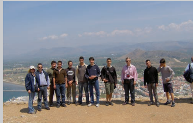
Από τις δύο ημερήσιες εκδρομές του Λυκείου.

Το Γενικό Εκκλησιαστικό Λύκειο Κορίνθου συμμετείχε στη διάρκεια του σχολικού έτους 2007-2008 σε καινοτόμα προγράμματα του Υπουργείου Παιδείας με ευρωπαϊκή συγχρηματοδότηση, η ολοκλήρωση των οποίων έγινε με ημερίδα στο Γυμνάσιο Βραχατίου με θέμα «Συμβουλευτική Σχέση – Έννοια, Σκοποί, Μέθοδοι, Είδη της Συμβουλευτικής» και την πραγματοποίηση δύο ημερήσιων εκδρομών με εκπαιδευτικούς στόχους. Η παρουσίαση της εργασίας του σχολείου είχε θέμα «Ποιμαντική Συμβουλευτική» και έγινε από τους μαθητές της Γ' Τάξης με στόχο να προβάλουν στους συμμαθητές τους την οπτική της Εκκλησίας στη συμβουλευτική σχέση.