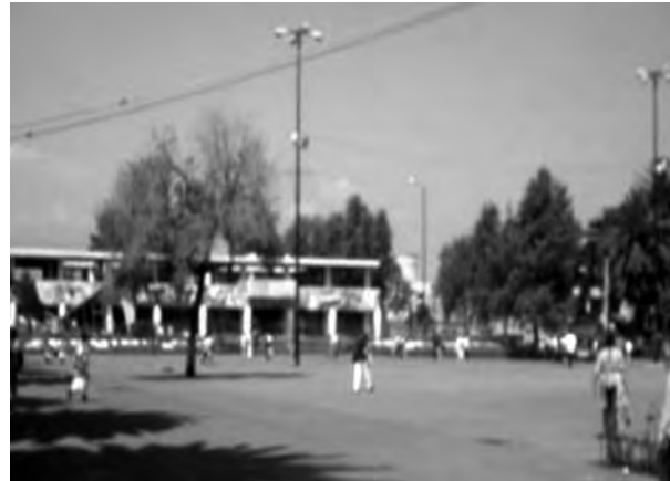
Figura 8. En el sitio correspondiente al Palacio Municipal, en 1972, se construyó el Foro Quetzalcóatl, edificio sin calidad arquitectónica que agredió las visuales de un espacio público patrimonial.