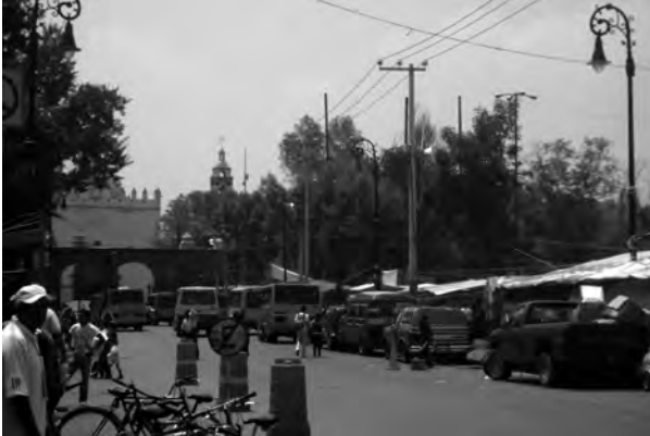
Figura 3. Tramo de la avenida Guadalupe I. Ramírez en el que se ha reducido considerablemente la circulación peatonal por la presencia de microbuses, autos, puestos semifijos y bicicletas.

esta situación. 15 La Carta Internacional de las Ciudades Históricas es enfática a este respecto: