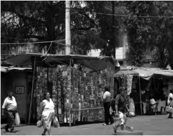
Figura 2. Los puestos semifijos obstaculizan las visuales históricas-urbanas del Centro Histórico de Xochimilco.

causado pérdidas irreversibles de carácter socioeconómico y cultural. Aun cuando existe una normatividad para los centros históricos, en el caso de Xochimilco prevalece la falta de seguridad pública, desorden en el transporte colectivo y la vialidad, e incremento del comercio informal en vía pública; problemas agudos que no han sido del todo resueltos y ha propiciado un acelerado deterioro de este Patrimonio Cultural de la Humanidad.