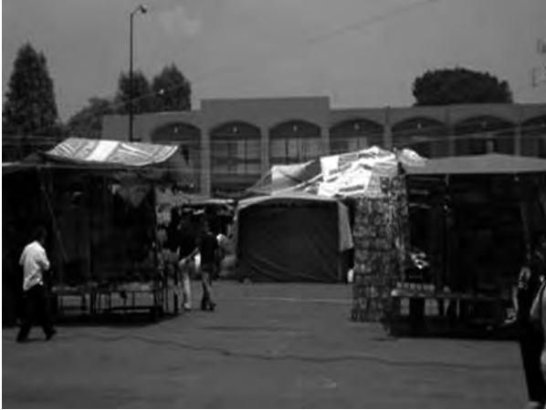
Figura 9. El comercio informal, ubicado en la plaza principal, impide apreciar cabalmente el actual edificio delegacional de Xochimilco.

dos por los paramentos de los edificios o los límites de predios; en ellos la población circula, se reúne, descansa o se recrea, pero sobre todo es un punto de cohesión de la identidad de Xochimilco. Los lugares de reunión por excelencia son la plaza y el jardín central, y junto con la actividad comercial del mercado refuerzan la convivencia de los pobladores. Los canales y chinampas también deben considerarse espacios públicos de reunión, en tanto cumplen funciones de recreación, comunicación, riego y pesca.