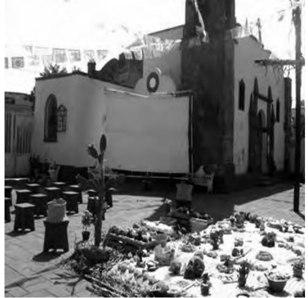
Figura 10. Plazuela de la capilla del barrio de Belén Acampa, donde los integrantes del Colectivo Tollan promueven el rescate de las tradiciones, lo que favorece el uso digno del espacio público religioso.

Por su ubicación en el Centro Histórico, el atrio de San Bernardino se ha convertido en un importante espacio público en el que se realizan tanto ceremonias religiosas como actos públicos, tales como conciertos, exposiciones fotográficas, obras de teatro, etcétera. Otros espacios de cohesión social son las plazuelas de los barrios ubicados frente a las capillas, donde se realizan actividades religiosas y civiles. En Xochimilco existen diversos grupos que realizan actividades culturales en los espacios públicos y religiosos, entre ellos el grupo Tlatemoani que difunde las tradiciones, leyendas e historia de Xochimilco a través del teatro, la danza y la música. El Colectivo Chachalaca Tlahtoa es un proyecto multidiscipli-