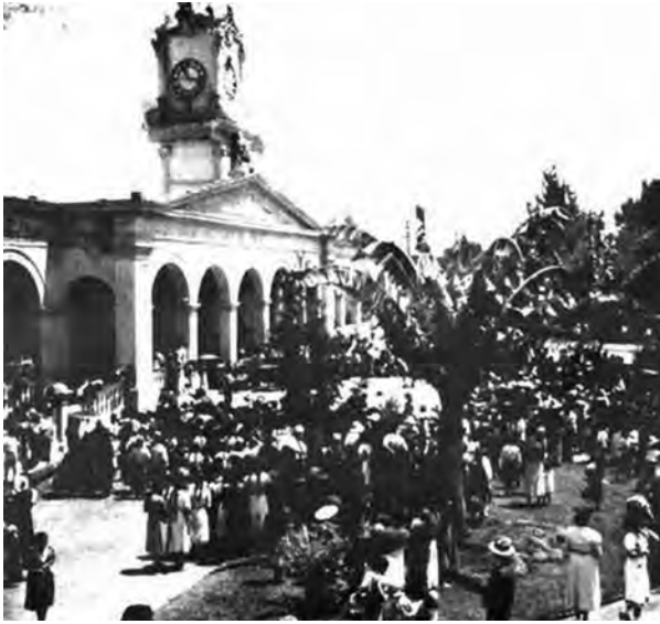
Figura 7. El Palacio Municipal, ubicado en la plaza pública de Xochimilco fue construido en la segunda mitad del siglo XIX; lamentablemente este bello ejemplo de arquitectura civil pública fue destruido en 1951.

portante de reunión para la población por su significado social y carga simbólica.