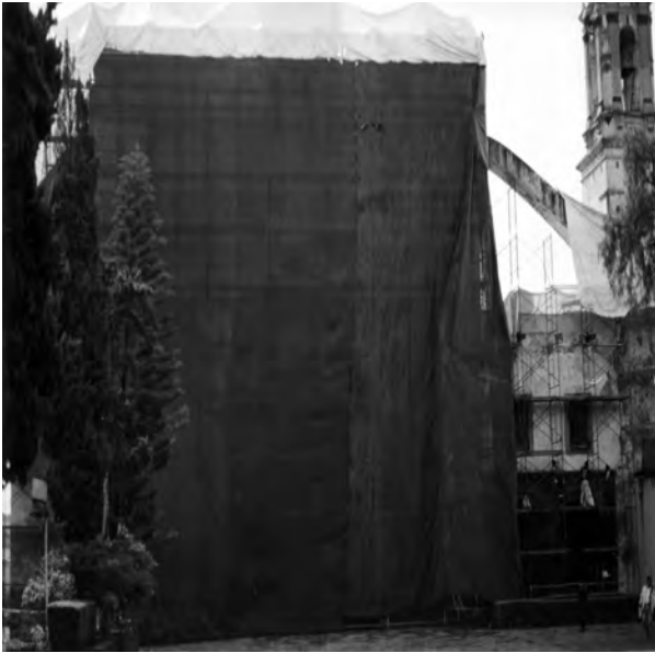
Figura 6. Trabajos de restauración en la fachada principal y capilla de indios del antiguo convento de San Bernardino de Siena.