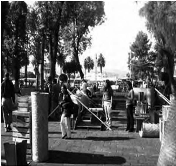
Figura 11. Tianguis del Huacal, evento organizado por el Colectivo Chachalaca Tlahtoa en el centro de Xochimilco, con el objetivo de recuperar el espacio público a través de la difusión de expresiones culturales y artísticas.

viento y danzantes engalanan el paso de las procesiones. Iglesias, capillas, casas y calles se transforman temporalmente en espacios sagrados adornados con portadas de flores y banderitas de colores. La dualidad de lo material e inmaterial es inseparable en la dinámica cultural. Las festividades religiosas son una amalgama de tradiciones, creencias, memoria colectiva e individual, ritos, sentidos, emociones, valores, sonidos, olores, sabores, decoración efímera y rutas sagradas.