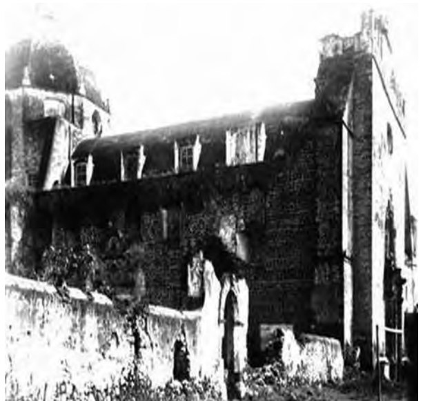
Figura 5. El templo y antiguo convento de San Bernardino de Siena es una construcción franciscana del siglo XVI que ha tenido severos problemas estructurales de conservación.

La década de 1970 fue una etapa difícil en lo que concierne a la conservación del conjunto conventual, sobre todo porque las intervenciones realizadas no estuvieron sustentadas en un proyecto integral de restauración, y tampoco se tuvo la asesoría técnica adecuada, con la consecuente alteración de muchos elementos arquitectónicos originales. En ese sentido, la Secretaría de Patrimonio Nacional, a cargo de Guillermo Lerdo de Tejada, señaló: