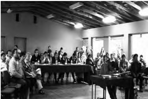
Figura 4. El Seminario-Taller SIRCHAL, realizado en noviembre de 2004, buscó generar propuestas para la rehabilitación integral del patrimonio cultural de Xochimilco.

problemática del Centro Histórico y la zona húmeda de la montaña y área lacustre. 17