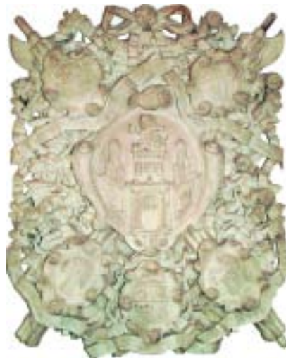
Marmeren schoorsteenstuk uit de zg. 'Zaterdagsche burgemeesterskamer' in de Stadstimmerwerf, met de wapens van de vier burgemeesteren en de stadssecretaris, 1723 (nu in het stadhuis)