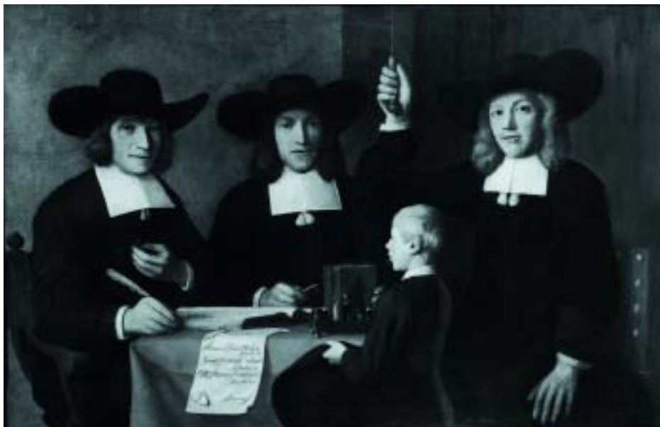
Drie regenten van het Burger-weeshuis te Alkmaar, 1680.