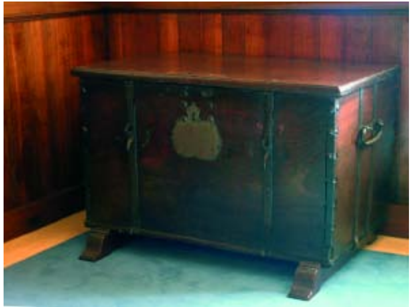
Secretariskist, ca. 1600

Voor het waarnemen van het ambt was al spoedig meer dan één persoon nodig, want de secretaris deed dienst bij burgemeesteren en de vroedschap, bij schepenen en bij de weeskamer. Eind 16 e eeuw (1572) zijn er 2 stadssecretarissen: één voor het bestuur (burgemeesteren) en één voor het gerecht (schepenen). Tijdens de Republiek dienden de secretarissen tot bijstand: één van de gedeputeerden ter dagvaart, één van de burgemeesteren en de vroedschap, één van schepenen en de Weeskamer. Ook waren de secretarissen belast met de ontvangst der verpondingen en ‘extra-ordinaire contributiën’. Er waren dan ook twee of soms zelfs drie secretarissen, meestal voor een afzonderlijke functie aangewezen, terwijl de werkzaamheden ook wel gezamenlijk werden verricht.