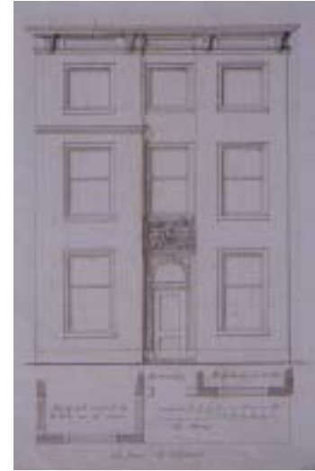
Tekening van de voorgevel van 'De Twee Steden'

Vanwege de hoge kosten werd het de stadsbestuurders van Enkhuizen in 1665 toegestaan in het Alkmaarse logement in te trekken, waarbij Alkmaar uiteraard de eerste rechten had, als eerste van de 7 stemhebbende steden in het Noorderkwartier. Sinds die tijd noemde men het trots 'De Twee Steden', met de stadswapens van Alkmaar en Enkhuizen op de gevel.. Dit logement heeft dienst gedaan tot 1795 toen de Republiek der Verenigde Nederlanden aan haar einde kwam. In 1800 werd het logement voor 9000 gulden verkocht.