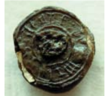
Schepenzegel van Willem de Wilde, schepen in 1399

Vanaf eind 1749 waren jaarlijks 3 van de 7 schepenen aangewezen als commissarissen voor de 'gemeenelands-middelen' in het ressort Alkmaar. De betrekking van schepen was niet erg gewild en 'menigvuldig' waren de verzoeken om niet op de nominatie gebracht te worden. Om nu niet tot een lagere klasse van burgers te moeten afdalen en 'het declin van zoo aanzienlijk collegie te voorkomen', besloot de vroedschap op 9 dec. 1769, dat haar 4 jongste leden vanaf hun aanstelling minstens driemaal schepen moesten zijn. Deze bepaling werd op 19 okt.