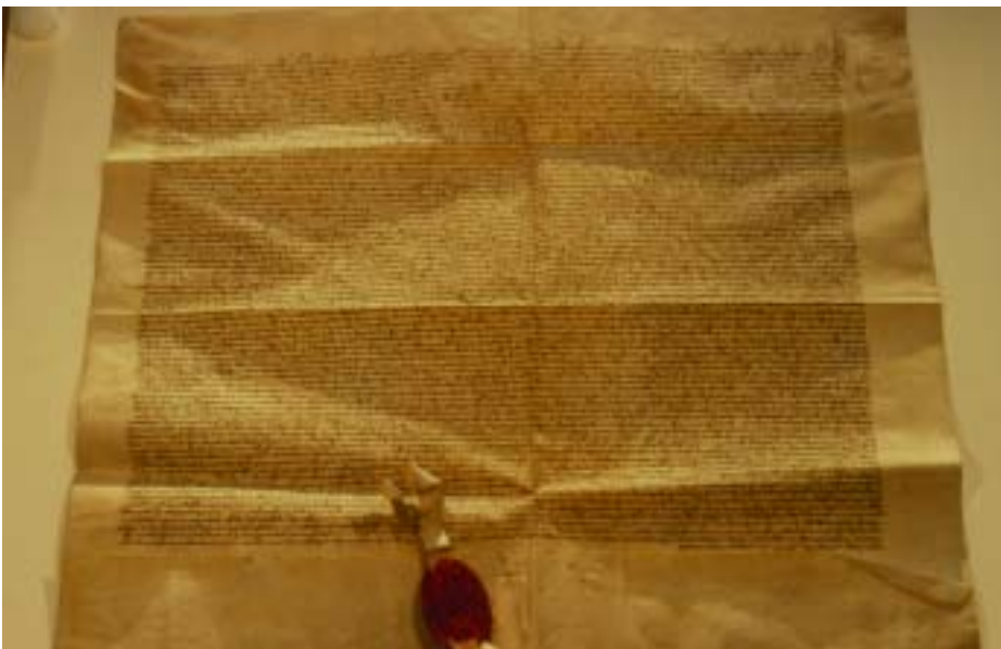
Vidimus uit 1463 van het stadsrecht van 1254 (RAA Stadsarchief nr.1)

De schout werd meestal voor een periode van een jaar aangesteld. Hij kreeg geen salaris, maar moest een inkomen zien te verwerven uit de opbrengsten van de rechtspleging. In de praktijk bleek dit winstgevend, want het schoutambt werd vaak door de graaf in leen gegeven. Zo werd in 1454 het schoutambt voor 50 jaren in leen verkregen door Willem, heer van Egmond. Die liet het werk door plaatsvervangers (substituten) verrichten. Hun benoeming was wel onderworpen aan goedkeuring door de graaf. Tot aan de opstand tegen Filips II hield de landsheer het recht van benoeming van de schout aan zich. Gelet op de belangrijkheid van de functie (zelfs de schepenen werden door de schout benoemd) was de stadsregering er veel aan gelegen het schoutambt naar eigen inzicht in te vullen.