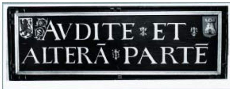
Tekstbord uit Schepenkamer: 'Hoor ook de andere partij', ca. 1620

1778 zodanig geïnterpreteerd, dat alle nieuw aangekomen vroedschappen gehouden zouden waren het schepen-ambt 6 jaar (het jaar van aankomst als vroedschap al schepen zijnde meetelend) waar te nemen, tenzij al een betrekking vervullend (of verkrijgend) die incompatibel was met dit ambt.