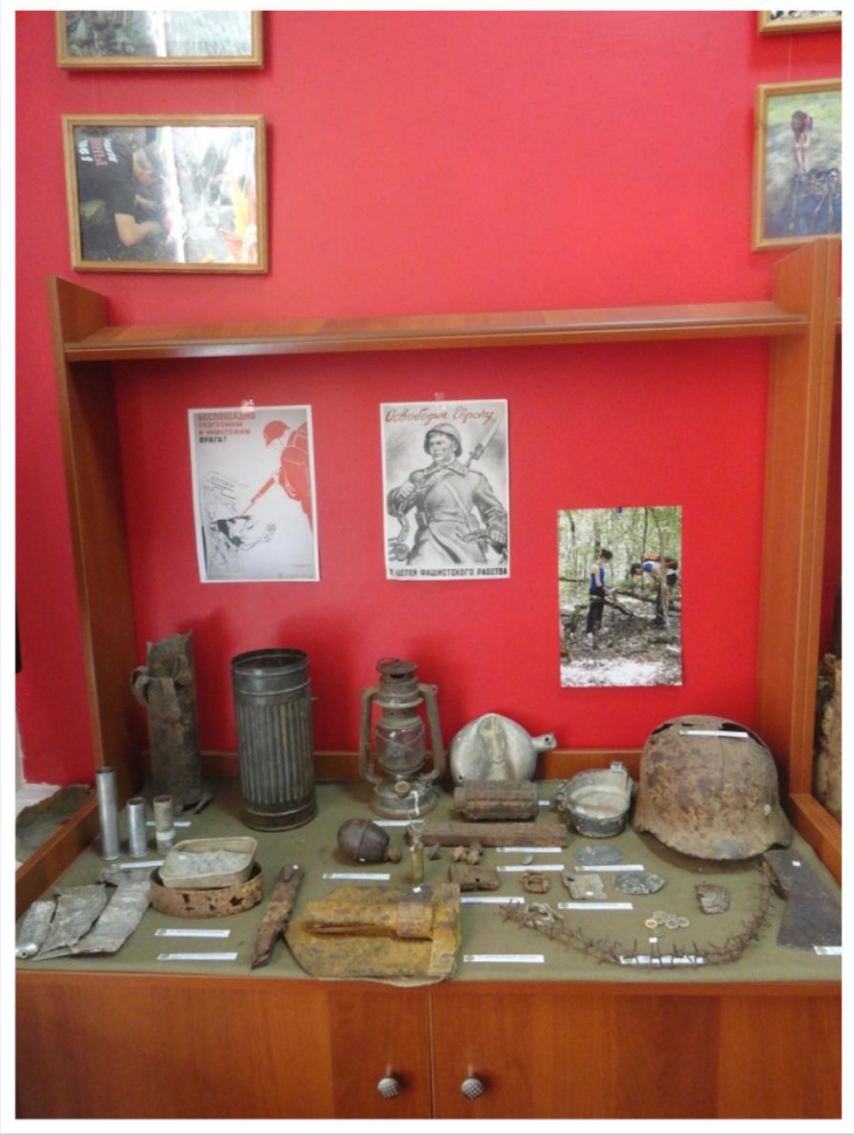
Личные вещи и вооружение солдат вермахта