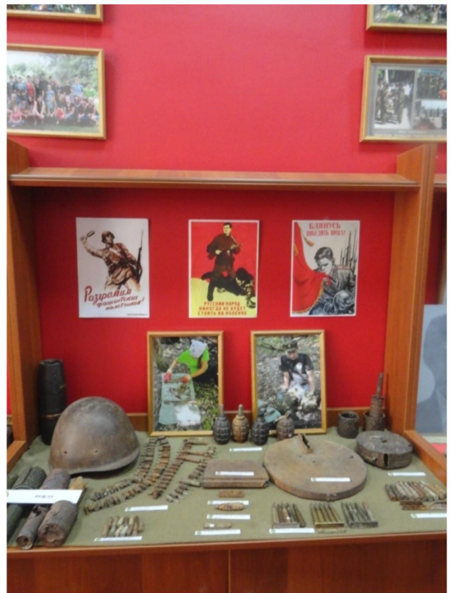
Вооружение времен ВОВ