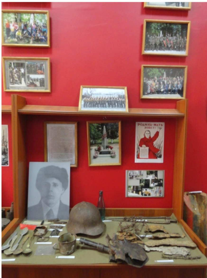
Личные вещи солдата РККА