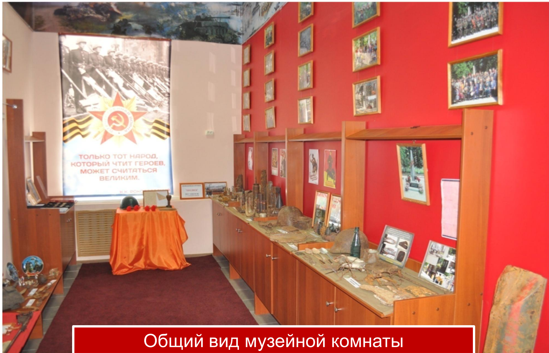
Общий вид музейной комнаты