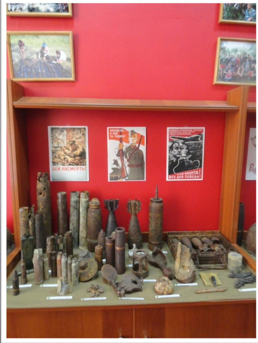
Гильзы, снаряды времен ВОВ