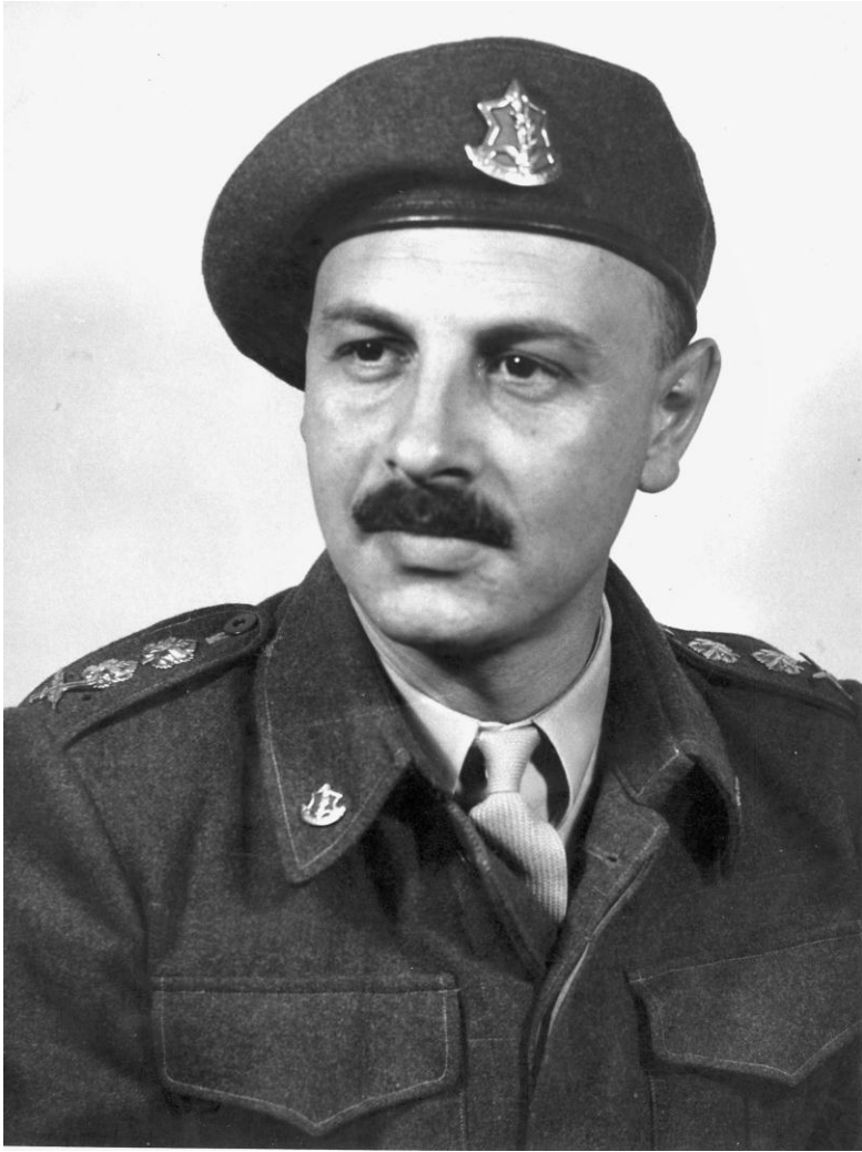
רב-אלוף יגאל ידן ראש המטה הכללי השני של צה"ל