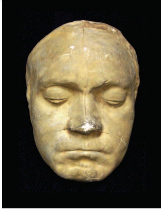
Beethoven halotti maszkja

A csontvezetésnél ugyanis az történik, hogy a csontok rezgéseit ugyanúgy átveszi a belső fül, mint rendes hallás esetén a levegő rezgéseit, és a belső fülben ugyanolyan idegingerületek jönnek létre, mint rendes hallásnál. A csontvezetés esetében tehát végül is az agy hangrezgéseket érzékel. Nos, nem valószínű, hogy Beethoven ilyen módon érzékelt volna hangrezgéseket a belső fülben, a cochleánál létrejött elcsontosodás miatt. Sokkal valószínűbb, hogy az arc- és koponyacsontok rezgése valami más módon alakult át benne hangélménnyé. Ismeretes, hogy a rosszul halló emberek némelyike a vibrációt úgy tudja felfogni, mint hangélményt. Beethoven is