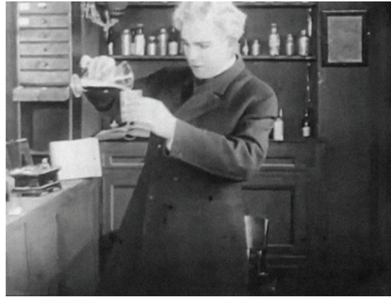
Abbildung 26.5: Dr. Jekyll mischt sein Gebräu (Dr. Jekyll and Mr. Hyde (1911))

Dr. Jekyll and Mr. Hyde (1911) ist ein Film im Stil der amerikanischen Produktionen jener Zeit, ähnlich wie es auch Frankenstein (1910) bereits war: Der Film versteht sich nicht als Kunstwerk, sondern lediglich als eine Geschichte in Bildern, und ist somit sehr geradeaus und mit minimalen Mitteln inszeniert. Mit James Cruze spielte ein erfahrener und angesehener Schauspieler die Hauptrolle, der 1960 posthum auch mit einem Stern auf dem Hollywood Walk of Fame geehrt wurde. Aber die Effekte bleiben spärlich. Die Verwandlungsszenen bestehen zumeist nur aus Schnitten, und wenn