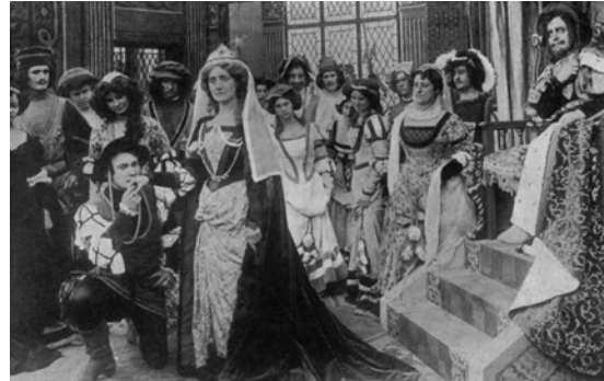
Abbildung 26.4: Aushangsfoto von Skarpretterens Søn (1911)

Aus Dänemark stammt der verschollene Film Skarpretterens Søn (1911) 36 , in welchem eine Hexe erscheint und dem Sohn eines Henkers ein magisches Schwert übergibt.