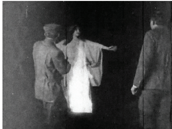
Abbildung 26.6: She (1911) betritt das magische Feuer ein zweites Mal

Der Forschungsreisende Horace Holly entdeckt in den Tiefen Afrikas eine verlorene Zivilisation, welche von einer wunderschönen, verschleierten Frau beherrscht wird. Diese wurde durch eine magische Flamme unsterblich und lebt seit Jahrtausenden an diesem Ort, auf die Reinkarnation ihres Geliebten namens Kallikrates wartend. Sie denkt, dass Hollys Begleiter Leo Vincey die Reinkarnation von Kallikrates ist und möchte, dass auch er als Unsterblicher an ihrer Seite verbleibt. Um Leo die Angst vor dem Feuer zu nehmen, betritt sie es ein zweites Mal; doch hierdurch wird sie ihrer Unsterblichkeit beraubt. Ihr wahres Alter bricht über sie herein, sie altert und stirbt vor den Augen der beiden Forscher.