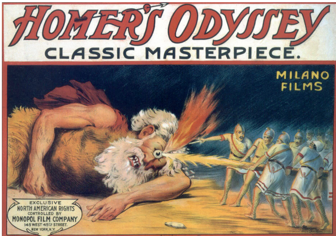
Abbildung 26.1: US-Filmplakat, Half-Sheet, 1911

Beim Film überragte L'inferno (1911) in diesem Jahr alles. Keine andere Produktion konnte hinsichtlich Dauer und Produktionswerten einem Vergleich standhalten. Auch was die Ernsthaftigkeit betrifft, ragt L'inferno (1911) wie ein Leuchtturm aus dem Meer der seichten Unterhaltung jener Tage heraus. Aber das heißt ja nicht, dass man ansonsten in eine Schreckstarre gefallen und untätig gewesen sei.