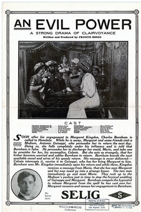
Abbildung 26.7: Werbeflyer zu An Evil Power (1911) aus der Margaret Herrick Library der Academy of Motion Picture Arts and Sciences

William Nicholas Selig produzierte An Evil Power (1911) 59 , von welchem auch keine Kopie mehr existiert.