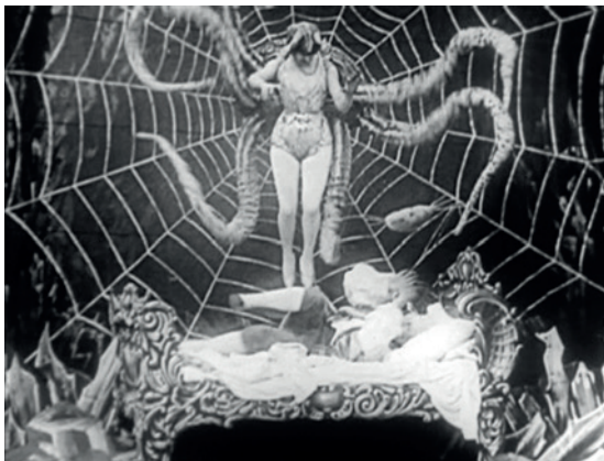
Abbildung 26.2: Die Spinnenfrau bedroht Baron Munchhausen

Gleiches gilt für Il purgatorio (1911) 8 , eine kleine Produktion der Ambrosio, die sich den Erfolg von L'inferno (1911) zunutze machen wollte - auch sie kann als verschollen angesehen werden. Bei beiden Filmen dürfen wir nicht vergessen, dass sie kleine, schnell abgedrehte Produktionen waren.