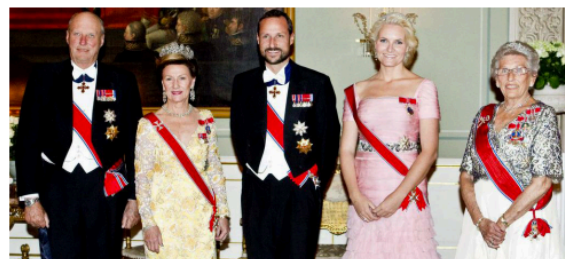
Utgifter til kongehuset 2010-2016

Vi henvendte oss først til Finansdepartementet og etterspurte en oversikt der statens utgifter til kongehuset framgikk. Vi fikk ingen samlet oversikt, men ble henvist til en budsjettpost på 232 millioner. Tallet virket lavt. Vi hadde lest at kongeskipet alene kostet rundt 40 millioner i året. Fantes det flere utgifter enn de tallene departementet viste til? Vi søkt rundt i ulike deler av statsbudsjettet og førte inn utgifter fortløpende. Vi fant og en utgifts-oversikt i Kommunaldepartementets budsjettproposisjon, men manglet den manglet både totaltall, gardens vakhold på kongelige eiendommer og konkrete utgifter til Den kongelige politieskorte (DKP - kongens livvaktjeneste). Dermed fikk ikke leseren noe totaltall å forholde seg til. Vi hentet inn alle de budsjettallene vi fant fra 2010 til forslaget for 2016 for alle utgiftspostene vi hadde identifisert. Men uten DKP