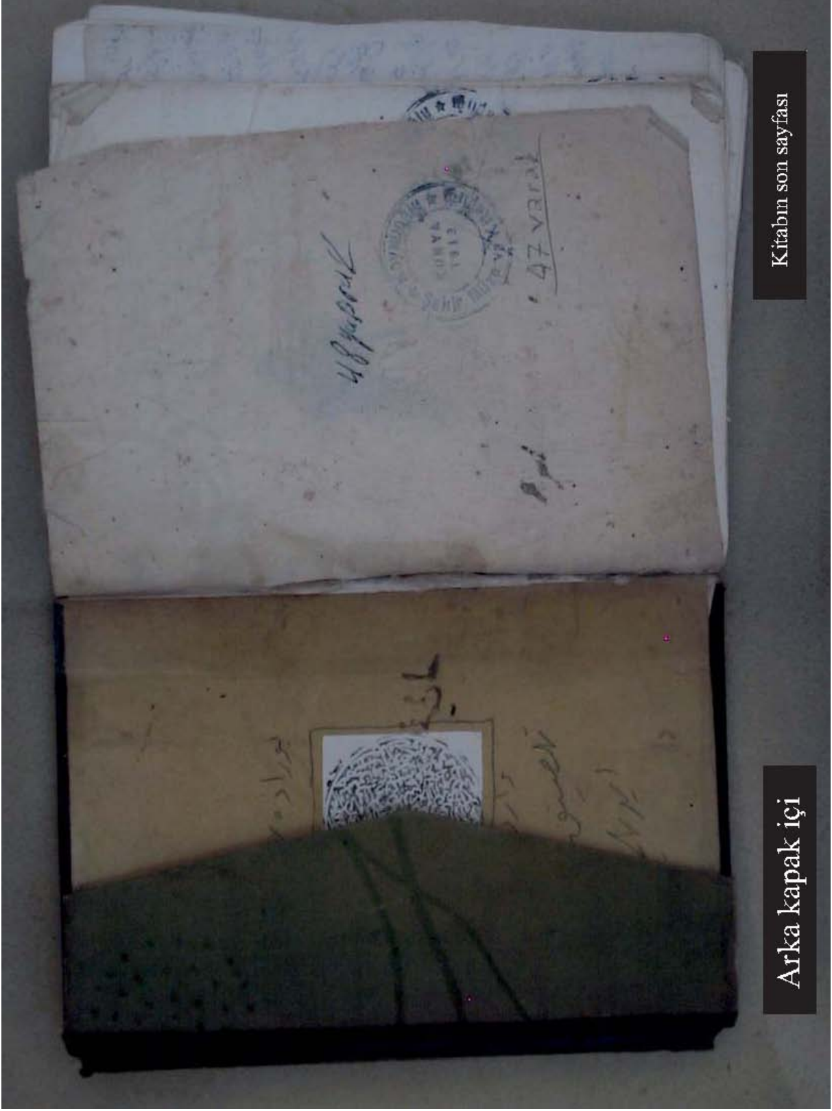
Kitabın son sayfası