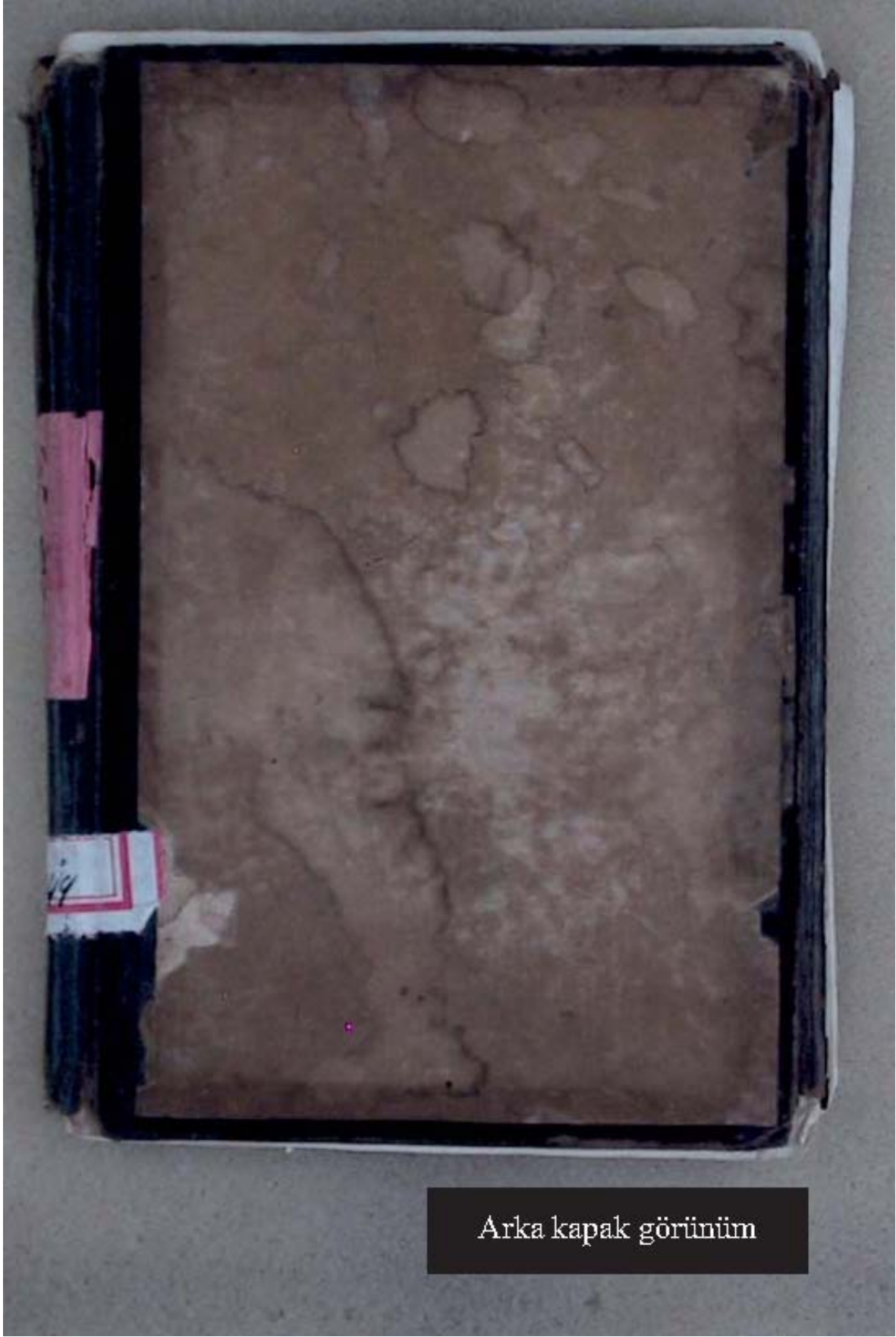
Arka kapak görünüm