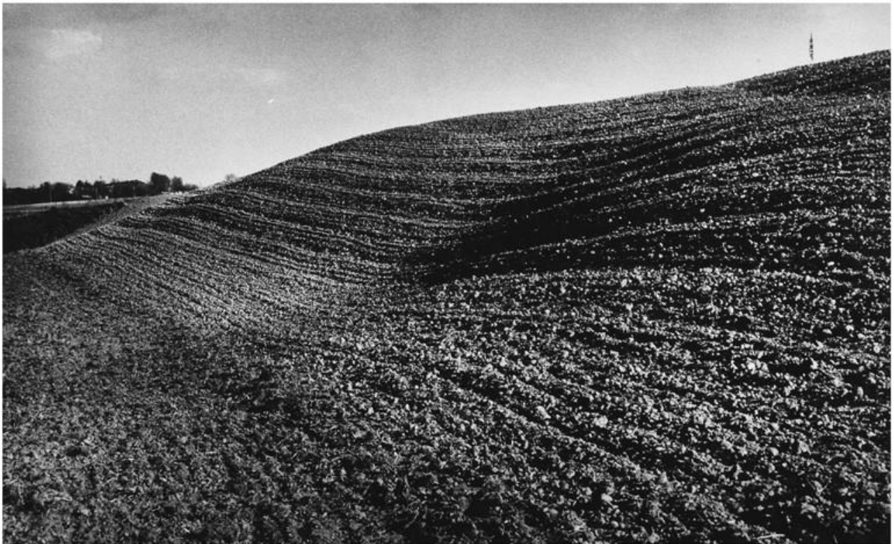
Nietulisko Fabryczne II