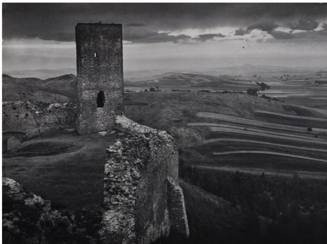
Widok z chęcińskiego zamku