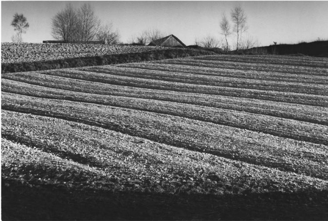
Wiosna w Krajinie