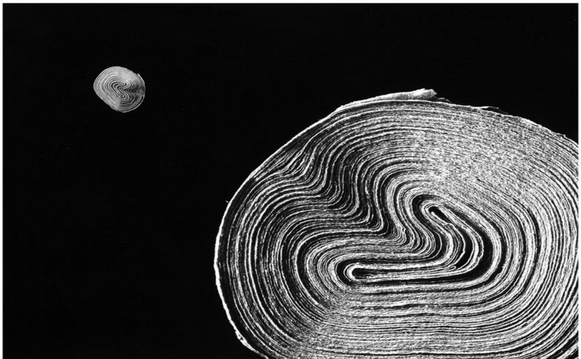
Gen - 67