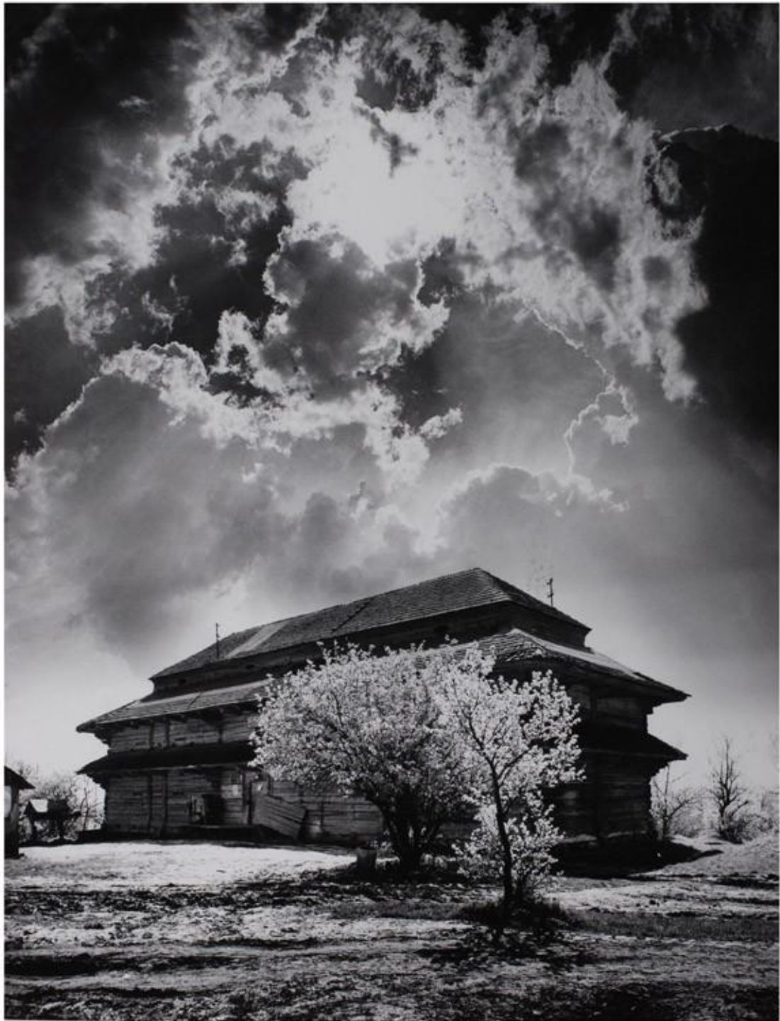
Spichlerz w Złotej Pińczowskiej