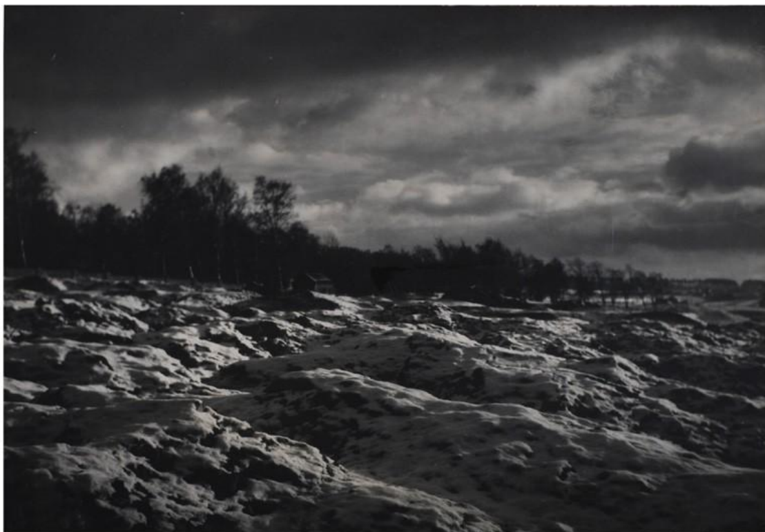
Kielce - „Psie Górki”