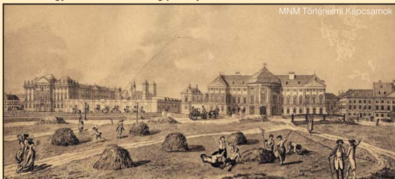
A magyar nemesi testőrség palotája Bécsben, 18. század. Rézmetszet

A testőri évek alatt folytatott irodalmi és nyelvi stúdiumok jelentős szerepet játszottak az úgynevezett nemesi testőrírók, közöttük is elsősorban Beszenyei György, Barcsay Ábrahám, Czirkék Mihály, Nalaczi József és mások kiművelésében, s általuk a felvilágosodás francia, valamint német literatúrájának hazai közvetítésében.