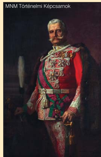
Fejérváry Géza báró mint a bécsi magyar testőrség főkapitánya

1912. december 13-án az uralkodó első főudvarmestere közölte vele, hogy Ferenc József kinevezte a bécsi magyar testőrség kapitányának. Így újra a császárvárosban kellett élnie (bécsi lakása berendezésére még 1903-ban tízezer koronát kapott a Mária Terézia-rendtől). Budapestet megszeretve, nem szívesen költözött Bécsbe, bár ott családja: leánya és veje, Burián István, aki hamarosan a király személy körüli magyar miniszter lett, gondoskodása vette körül.