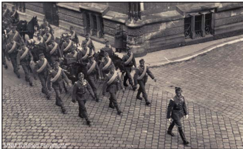
A Testőr Lovász Zászlóalj egy szakasza a Bécsi kapunál gyakorlatról tér vissza

A szélsőjobb oldali veszély növekedése, majd 1944 márciusában Magyarország német megszállása átrendezte a testőrségi szerepeket, s egyre inkább a biz-