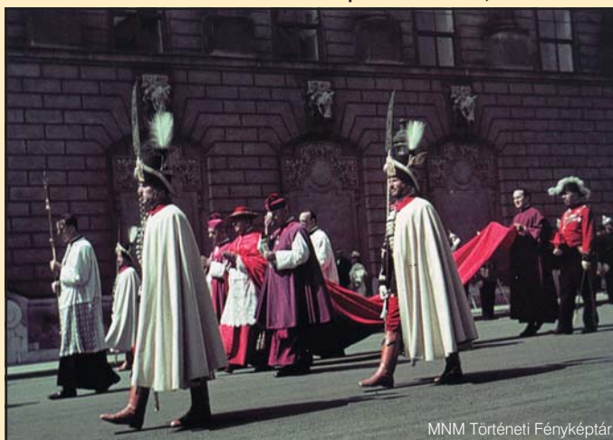
MNM Történeti Fényképtár

Bangha Ernő: A Magyar Királyi Testőrség 1920–1944. Budapest, 1990; a szerző külön köszöni Babucs Zoltán hadtörténelész szíves segítségét.