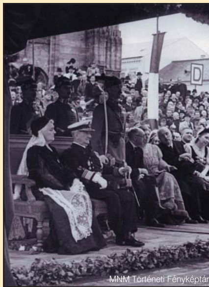
MNM Történeti Fényképtár