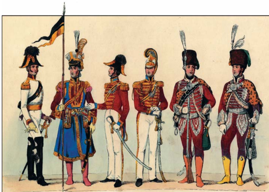
A bécsi udvar nemesi testőrei: cseh, galíciai, lombard–velencei és magyar, 18. század

Voltak a császári udvarnak más, rövid élettartamú testőrségei is, amelyek születése (és elmúlása is) politikai jellegű volt, így nem is lehetett sok közülük a klasszikus testőrségekhez, fennállá-