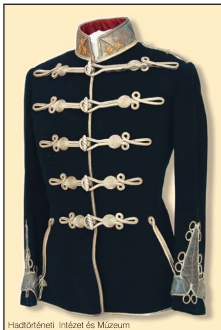
A Magyar Királyi Testőrség szolgálati atillája, 1880-as évek

A magyar történelmi emlékezetben a testőrségek között a legnagyobb hírnévre a Magyar Nemesi Testőrség emelkedett, soraiban nagyívű életpályát befutó személyiségekkel, katonákkal, közéleti emberekkel, tudósokkal, írókkal, költőkkel. Erről a pompás küllemű lovas csapatról – amely rövid megszakítással (1849–1867) közel másfél évszázadon át állt fenn – azt tartják, hogy ők voltak minden idők legszebb magyar