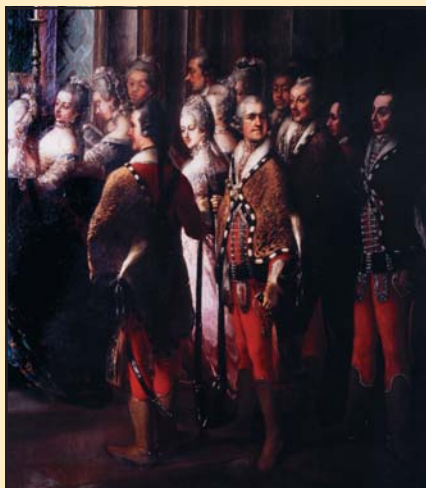
Magyar testőrök és bécsi udvarhölgyek a Szent István-rend ünnepén, 1764. J. F. Greipel freskója az innsbrucki Hofburgban

A gyakorlati oktatásban elsősorban a lovaglásra, a vívásra és a táncokta-