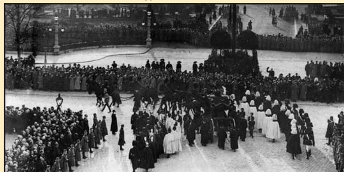
Ferenc József temetésén magyar és osztrák testőrök kísérik a menetet