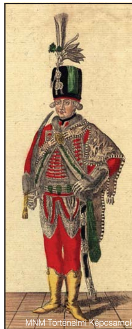
Magyar testőr, 18. század. Színezett rézmetszet

A díszes testőrök nemcsak a reprezentációnak, hanem a hatalmi legitimációnak is eszköze volt; a testőrségeket mintegy az uralkodói koronák tartozékának, a birodalmat alkotó országok és tartományok sajátos szimbólumának tekintették. A kor közfelfogásában a külsőségek a hatalom nagyságát, értékét, jellegét tükrözték. Pompa és fényűzés, szabályozott rend, színpadias, hideg etikett – ehhez szolgáltatták az élő kulisszát a testőrségek. Ha pedig egy testőrség funkciótlanná vált, hivatalosan feloszlatták (a testőröket „az uralkodó felmentette az esküjük alól” – mint tette azt IV. Károly osztrák császár és magyar király 1918-ban udvara összes testőrével), esetleg más mezben újjászervezték őket.