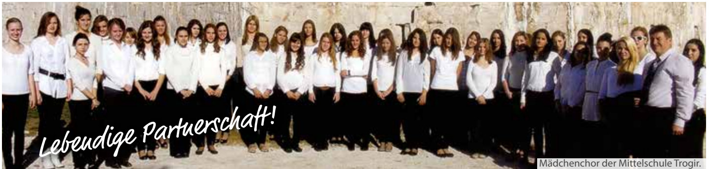
Mädchenchor der Mittelschule Trogir.