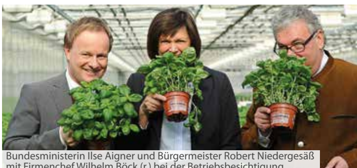
Bundesministerin Ilse Aigner und Bürgermeister Robert Niedergesäß mit Firmenchef Wilhelm Böck (r.) bei der Betriebsbesichtigung

Im Anschluss an Rede und Diskussion fand eine Betriebsbesichtigung des Vorzeigebetriebes in Neufarn statt. Die Gärtnerei Böck wurde 1896 gegründet und ist seit gut 40 Jahren in Neufarn ansässig. In 70 ha Glashäusern und auf rund 80 ha Freiflächen werden durch insgesamt rund 100 Mitarbeiter alle gängigen Gemüsepflanzen und Topfkräuter angebaut und vermarktet. Die benötigte Wärme für die Glashäuser bezieht die Firma Böck aus einer Biogasanlage, die von vier Landwirten der Umgebung betrieben wird und die auf dem Betriebsgelände errichtet wurde. Ilse Aigner und Robert Niedergesäß zeigten sich von dem modernen Betrieb, der zu den größten seiner Art gehört und sich bald erweitern möchte, sehr begeistert.