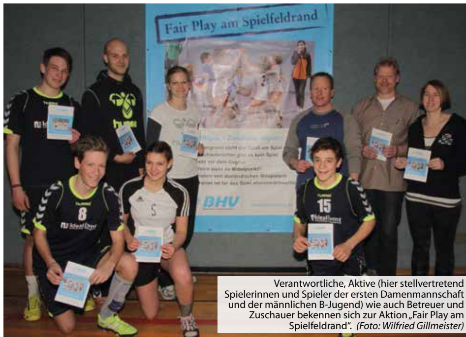
Verantwortliche, Aktive (hier stellvertretend Spielerinnen und Spieler der ersten Damenmannschaft und der männlichen B-Jugend) wie auch Betreuer und Zuschauer bekennen sich zur Aktion „Fair Play am Spielfeldrand“.

„Fair in den Frühling“ hat sich die Handball-Abteilung des TSV Vaterstetten vorgenommen und den ersten Heimspieltag im meteorologischen Frühling mit diesem Motto als Aktionstag zwecks Unterstützung der Initiative des Bayerischen Handball-Verbands für „Fair Play am Spielfeldrand“ gestartet.