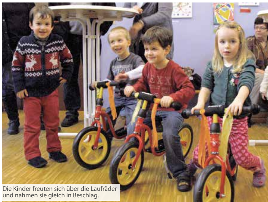
Die Kinder freuten sich über die Laufräder und nahmen sie gleich in Beschlag.

Da der „Fuhrpark“ und die Spielgeräteausstattung des Kinderhauses noch mehr erweitert werden sollen, sammelt der Elternbeirat mit verschiedenen Aktionen Geld, so auch mit der Ausstellung von Bildern, die die Kinder in unterschiedlichen Techniken hergestellt haben. Jedes Bild wurde für 10 Euro an die Eltern verkauft.