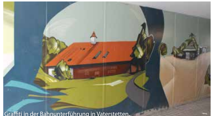
Graffiti in der Bahnunterführung in Vaterstetten.

Motiventwürfe/-beschreibung und eine kurze Bewerbung nimmt Jörg Cordruwisch (Jugendpflege Gemeinde Vaterstetten, Rathaus, Wendelsteinstraße 7, 85591 Vaterstetten) bis zum 30. April 2013 entgegen.