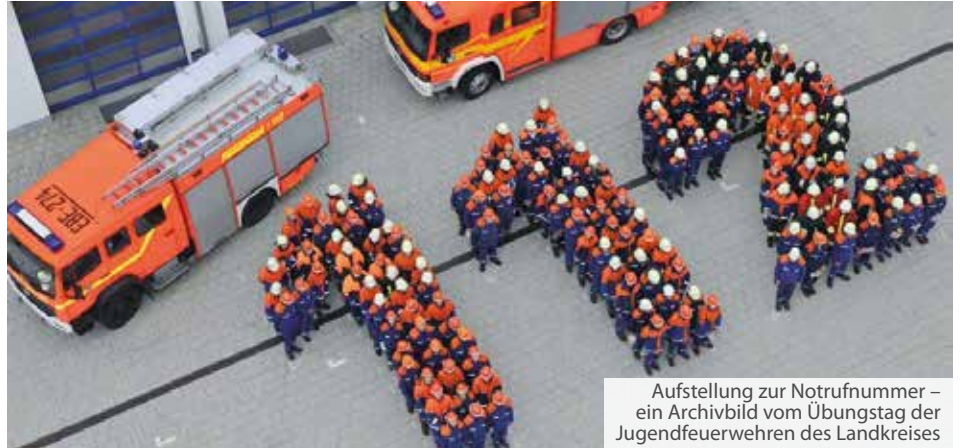
Aufstellung zur Notrufnummer – ein Archibild vom Übungstag der Jugendfeuerwehren des Landkreises

Als eine der ersten Gemeinden in der Region hat die Gemeinde Vaterstetten für sich einen Feuerwehrbedarfsplan erstellt. Er wurde im März dem Gemeinderat vorgestellt. Mit den darin enthaltenen Maßnahmen will die Gemeinde das Niveau, auf dem die freiwilligen Kameradinnen und Kameraden arbeiten, weiterhin konstant hoch halten und noch ausbauen.