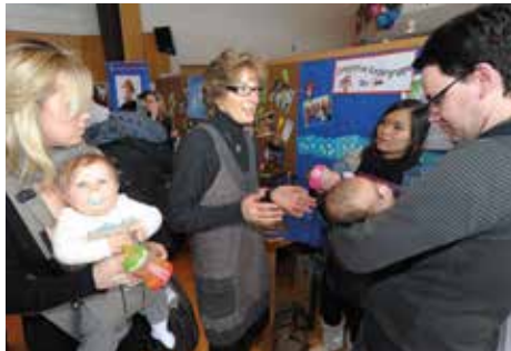
Wie jedes Jahr war der Babyempfang eine Kennenlern-Börse junger Familien untereinander sowie mit den Ausstellern.

Ende Februar hatte die Gemeinde Vaterstetten die jungen Eltern und ihre Sprösslinge zum 11. Babyempfang im Festsaal des GSD Seniorenwohn-parks eingeladen. Zur Begrüßung gab es für