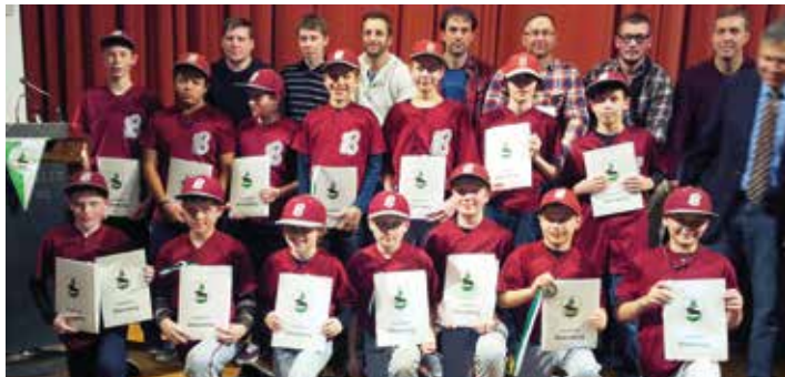
Die Boars wurden mit Urkunden und Medaillen für ihre außerordentlichen Leistungen ausgezeichnet.

Der Landkreis Ebersberg ehrt jährlich im Rahmen einer Feier die Sportlerinnen und Sportler, die im Vorjahr herausragende Leistungen erbracht haben. Bei der diesjährigen Sportlerehrung fand sich ein Großaufgebot der Baldham Boars in der Stadthalle in Grafing ein. Die Herren 1 wurden heuer Meister der Regionalliga Südost und erreichten damit auch den Aufstieg in die 2. Bundesliga. Die Schüler Livepitch Mannschaft gewann neben der Deutschen Hallenmeisterschaft in Gauting auch die Bayerische Hallenmeisterschaft in Schwaig und wurde beim Schüler-Baseball Bayerischer Vizemeister.