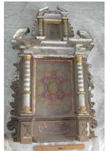
Reliquienaltärchen aus der Parsdorfer Kirche.

Im Dachboden über dem gotischen Chorgewölbe fanden sich nämlich zwei knapp einen Meter große Reliquienaltärchen mit den für die Kunst des 17. Jahrhunderts typischen Sprenggiebeln, die dort vergessen vor sich hindämmerten. Eingebettet zwischen zwei spiralförmige Säulchen bergen sie kostbare Klosterarbeiten, wie sie einst in Frauen-, aber auch Männerklöstern mit großer Kunstfertigkeit hergestellt wurden. In den Parsdorfer Altärchen umgeben auf roter Folie mehrere aus Goldfäden gestickte Blüten ein Wachs-