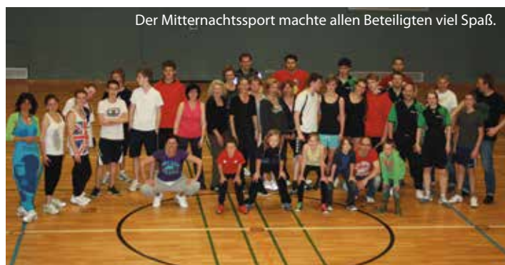
Der Mitternachtssport machte allen Beteiligten viel Spaß.

In der Sporthalle des Humboldt Gymnasiums konnten die jugendlichen Besucher zwischen den Sportarten Volleyball, Tischtennis und Handball wählen. Als besonderes Highlight wurde ZUMBA Fitness angeboten. War die Teilnehmerzahl nach dem 1. Mitternachtssport noch überschaubar, so konnten sich die Veranstalter diesmal über den großen Zuspruch von Jugendlichen und Familien freuen. Motiviert von diesem Erfolg wird der Mitternachtssport jetzt in regelmäßigen Abständen stattfinden.