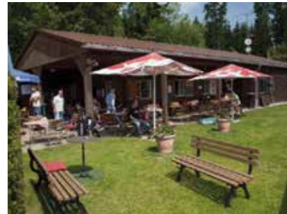
Gemütliche Einkehr im Tennisstüberl.