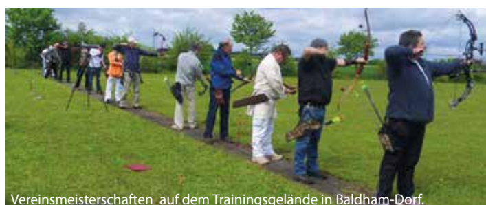
Vereinsmeisterschaften auf dem Trainingsgelände in Baldham-Dorf.

Vereinsmeisterschaft: Trotz des kühlen Wetters war die Vereinsmeisterschaft Mitte Mai gut besucht und selbst unsere Jüngsten schossen tapfer mit. Allerdings machte uns – wie anderen Vereinen auch – das Wetter einen Strich durch die Rechnung, und wir mussten nach der Hälfte aufgrund eines Gewitters abbrechen, da die Sicherheit der Schützen Vorrang hatte.