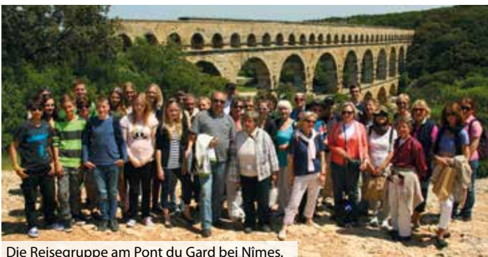
Die Reisegruppe am Pont du Gard bei Nîmes.