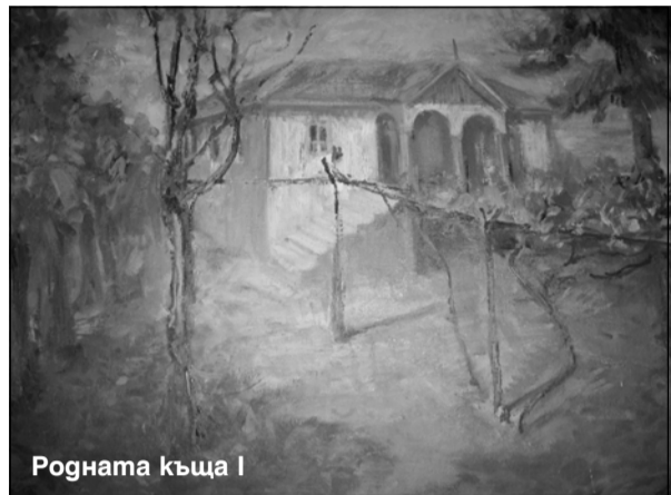
Рогната къща I