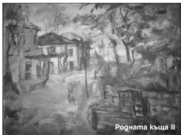
Рогната къща II