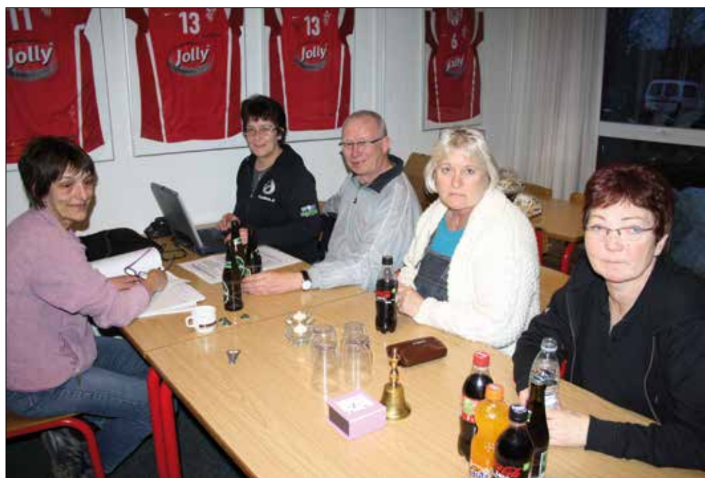
SEIFs Venners generalforsamling