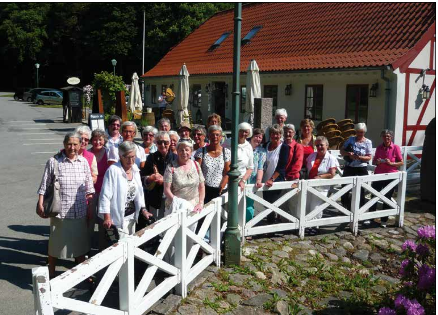
Gymnastikdamerne på deres 25. sommerudflugt.