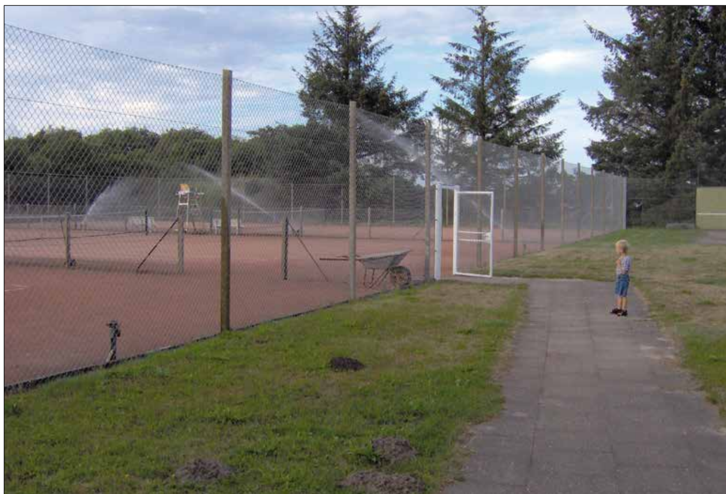
Tennisanlæg på Råsigvej