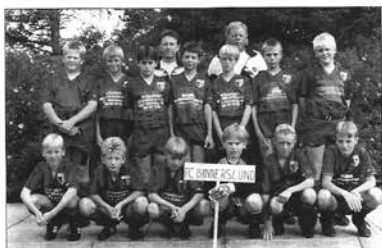
FC Bannerslund - Drengene 1993

"Vedrørende F.C. Bannerslund vedtager bestyrelsen, at NBU ikke længere har nogen interesse i at fortsætte samarbejdet, hvilket meddeles SEIF". Samarbejdet begyndte i 1992 og varede i 5 år. Grunden til denne beslutning lå ikke i, at NBU ikke ønskede ungdomsfodbold, men at man på lederiden manglede tilgang til klubben.