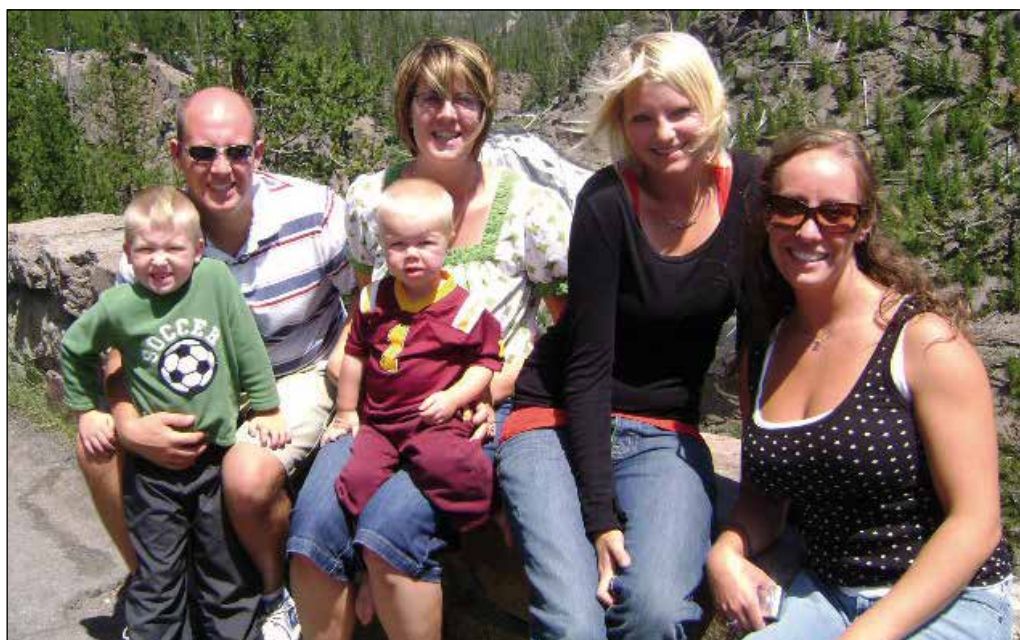
Karianne med værtsfamilien

Igen i 2005 modtog fodboldafdelingen en check fra OK Benzin og Dagli' Brugsen. Beløbet er opstået fordi OK og SEIF har en sponsoraftale omkring hver liter benzin der sælges på OK Benzin- og Dieselkort. De sidste 5 år har OK sponsoreret ca. 60.000 kr. til fodboldafdelingen i SEIF. I år er det ungdomsafdelingen der har stået for alle opgaver omkring sponsoratet.