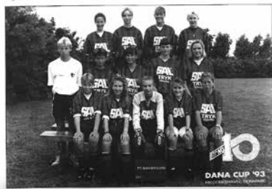
FC Bannerslund - Piger 1993

I 1996 var der ca. 120 spillere i F.C. Bannerslund, hvoraf ca. 1/3 kom fra NBU (Elling).