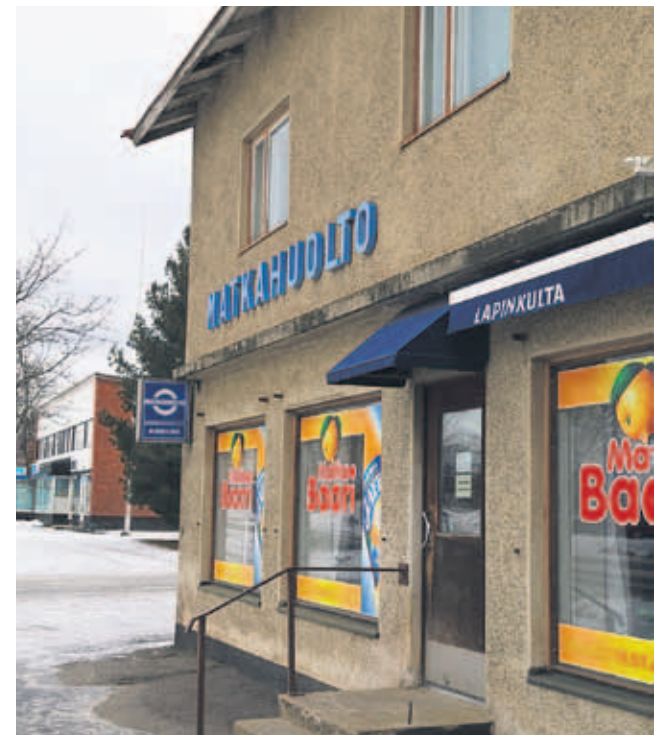
Sysmän Matkahuolto toimii Matka-baarin yhteydessä keskeisellä paikalla.