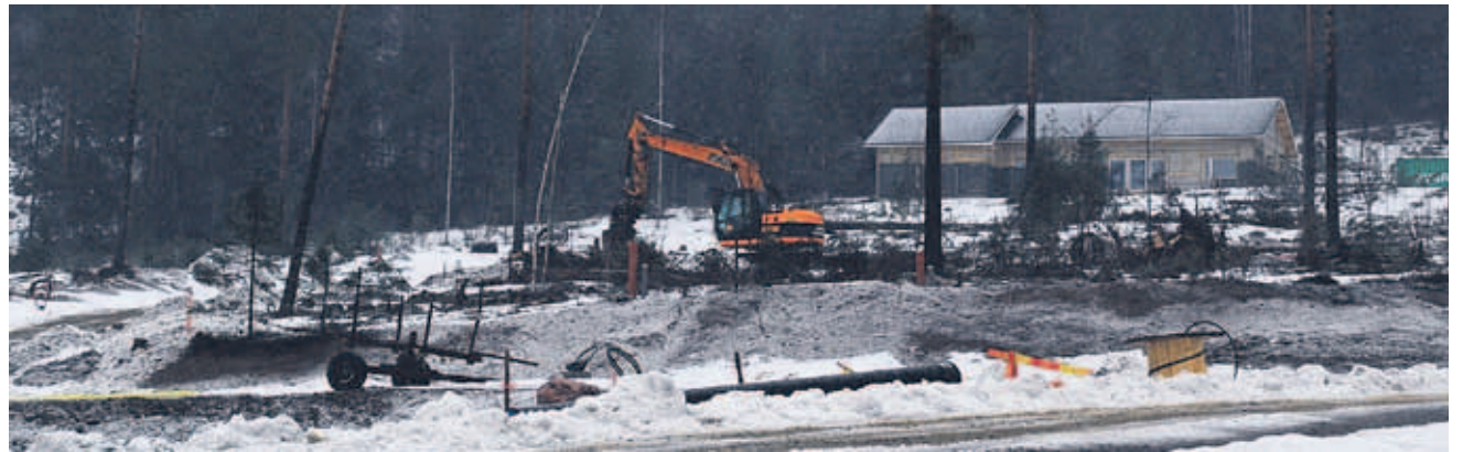
Vääksyn Pasolanharjun asuntoalueen katuja rakennetaan.

Asikkala satsaa Pasolanharjuun ja Häkälään, Sysmä kunnanvirastoon