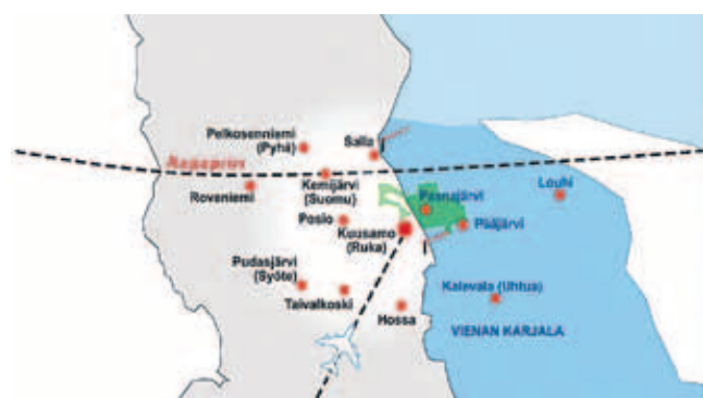
Kuusamon lentoaseman matkailualue, joka ulottuu myös Vienan merelle.