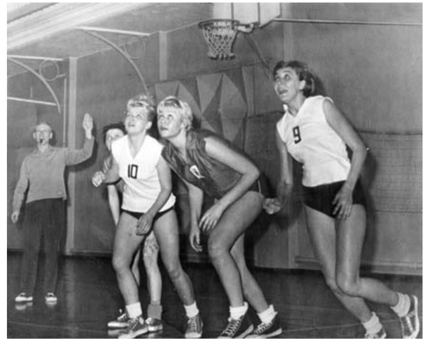
Цветной бульвар («баскетбольный Храм»). Первенство Москвы, 1964 г.