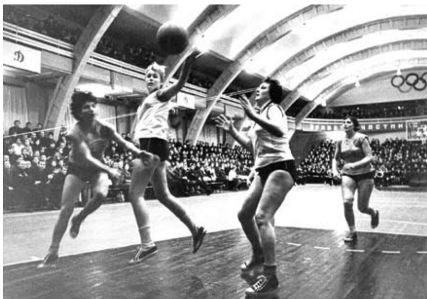
Чемпионат СССР, Новосибирск, 1965 г.

- Как оказались в команде мастеров? - Опять помог случай. К 15 годам я уже выросла под 190 см, а в конце 50-х - начале 60-х годов в Москве таких девушек можно было пересчитать по пальцам. Окончив курсы машинописи и стенографии, по распределению и волею судьбы попала на стадион «Динамо», где приступила к работе машинистки в республиканском совете «Динамо», параллельно продолжая заниматься в спортшколе у Равинского. Видимо судьбой уже было предreshено, что рано или поздно такую высокую девушку, как я (смеется), должны были заметить тренера динамовской баскетбольной команды. Так и произошло. Вскоре меня привлекли к тренировкам в «Динамо». А в 1963 году я попала уже в основной состав команды мастеров и отправилась на свой первый чемпионат СССР по баскетболу среди женских команд. - Вы выступали исключительно за московское «Динамо» на протяжении 17 лет. Откуда такая преданность клубу? Неужели не поступали предложения из других команд?