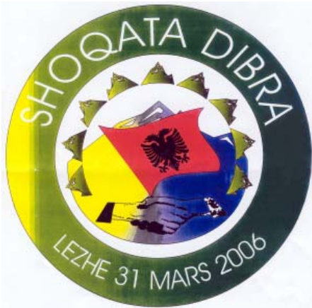
Stema e shoqatës "DIBRA" në Lezhë

Jemi mbledhur në këtë takim festiv, për të promovuar krijimin e Shoqatës "Dibra" në qytetin e Lezhës, që datëlindjen e saj e ka më datën 31 mars 2006, dhe njohjen e saj ligjore nga Gjykata e Rrethit Gjyqësor Tiranë me datën 15 shtator 2006.