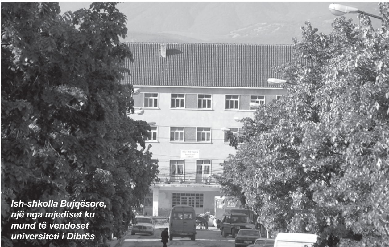
Ish-shkolla Bujqësore, një nga mjediset ku mund të vendoset universiteti i Dibrës

Në prefekturën e Dibrës ndodhen tre shkolla pedagogjike, të cilat janë një mbështetje e për krijimin e një dege të Universitetit, qoftë edhe ciklin e ulët, e cila do mblidhte studentë nga Kukësi e Mati, pse jo dhe nga matanë kufijve shtetërorë