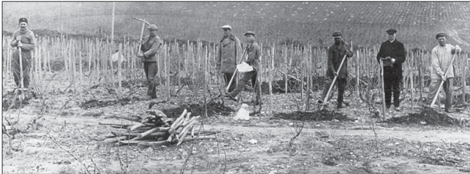
В довоенном колхозе.