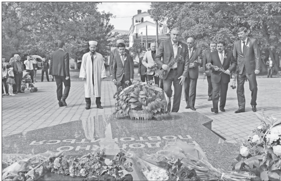
Возложение цветов.

Также участники акции установили на вершине Чатырдага памятную плиту,